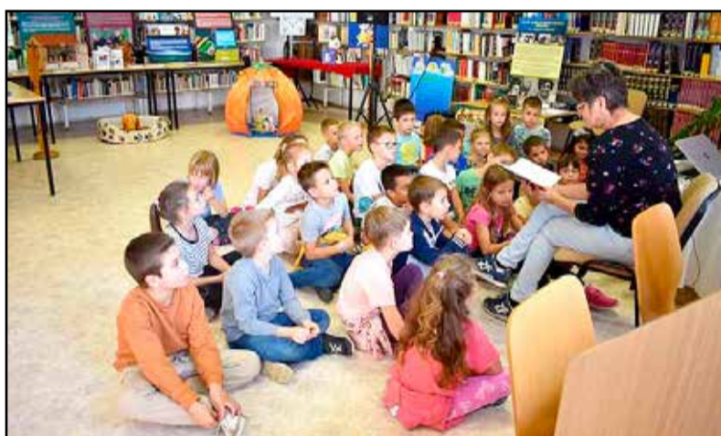
A gyerekek lelkesen hallgatták Bálint Ágnes meséit

A gyerekcsoportokat a kiállítás-hoz kapcsolódva mesefoglalkozással, tárlatvezetéssel várták a tamási könyvtárban. Bálint Ágnes a Magyar Televízió első gyermekműsor-szerkesztője, a magyar gyermek- és ifjúsági televíziós-műsorkészítés egyik megalapozója, a televíziózás hősorának meghatározó egyénisége volt. Számtalan közkedvelt mesesorozat, hangjáték, mese és meseregény írója, fordítója. József Attila díjas író, szerkesztő, dramaturg. Meséin nemzedékek nőttek fel. A Futrinka utca szombat esti félórás adását nemcsak a gyerekek, hanem mondhatnánk mindenki nézte, aki csak élt és televíziót nézett a hatvanas években, türelmet-