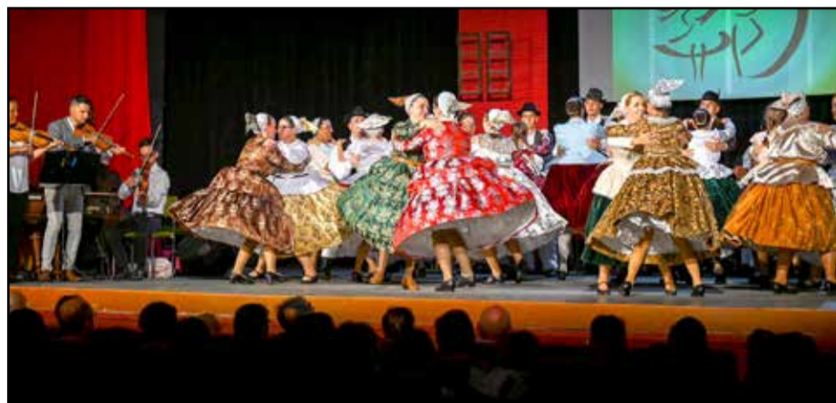
Teltház előtt léptek színpadra az együttes tagjai

A rendezvényre rekord gyorsasággal fogytak el a belépőjegyek. A két részes műsornak egy képzeletbeli utazás adott keretet. A műsorszámok közötti átvezető animáció és a táncokat, tájegységeket bemutató történetek és képi anyagok a nézők számára mesészerű néprajzi ismereteket nyújtottak. Az együttes valamennyi csoportja a legújabb táncokból válogatva szerepelt a műsorban. Pántlikások mellett vendégcsoportok is felléptek, a Sárpiliszi „Gerlice madár” Hagyományörző Nép-