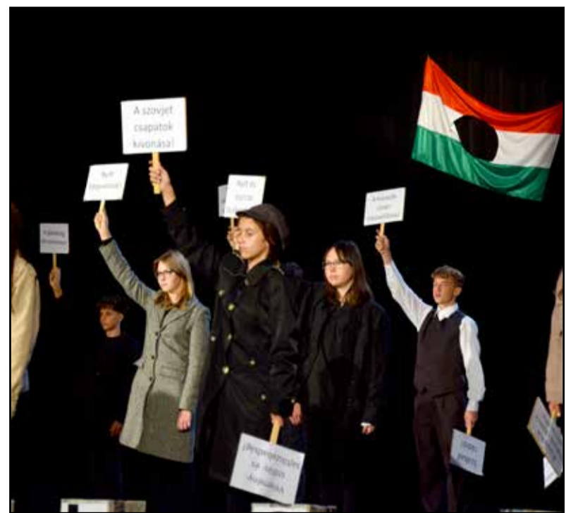
A Würtz iskola tanuló adtak műsort

emlékezünk. A szovjet birodalom és a helytartói azt hitték, bármit meg lehet tenni az emberekkel, bármit egy nemzettel, de tévedtek. A magyarok szabadságharcba kezdtek, és népek sora nézte néma csodálattal a magyarok bátorságát... Ha valami, ez a mi generációnk felelőssége, hogy át tudjuk örökíteni '56 szellemét a mai fiataloknak, hogy érezzék és tudják, amiben most élnek, annak természetessége őseinknek és hőseinknek köszönhető. Sokszor halljuk ma, 2023-ban is, hogy Magyarországon nincs demokrácia, sajtó és vé-