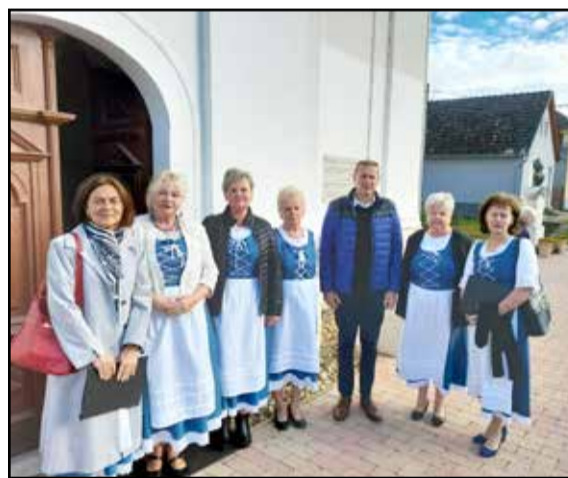
A Blumenkranz kamarakórus

mindannyian „Az úton” című ír áldást. Egy rendkívül színes és színvonalas előadásnak lehetünk részesei. Itt szembesültünk azokkal, hogy a térségben milyen aktívan és magas színvonalon művelik a kórusművészetet. A találkozó után a vendéglátók vacsorával vártak minden kórust a Györkönyi Művelődési Házban. A vendéglátás keretein belül lehetőség volt kötetlen beszélgetésre, ismerkedésre. Jövőre a találkozóhoz Pusztahencse ad otthont.