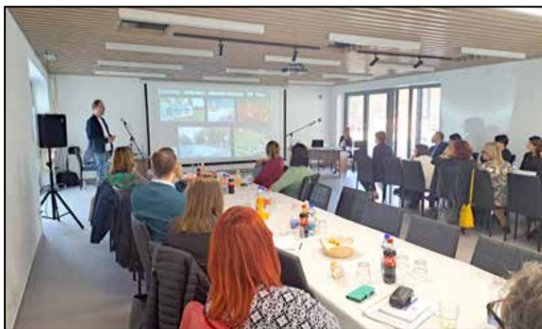
Fontos témákról egyeztettek a rendezvényen

A nap programja a délelőtti órákban hasznos szakmai előadásokkal indult. Tájékoztató hangzott