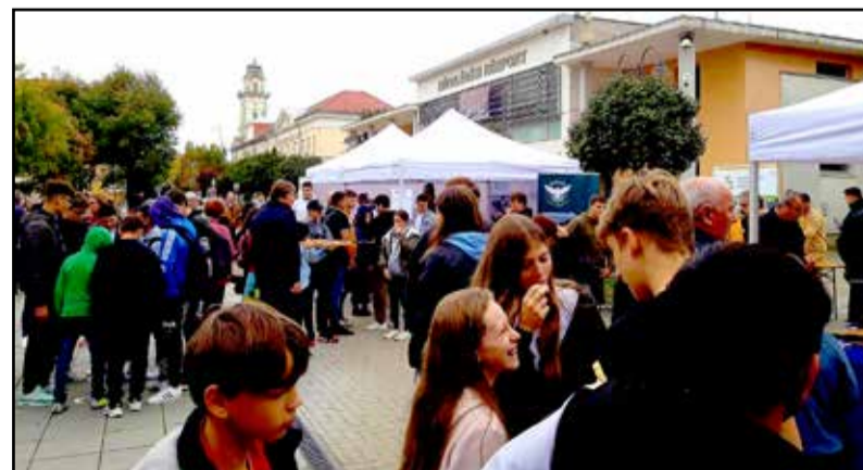
Megtelt a Túrmezei tér a rendezvény alkalmával

Az építőipar ágazat tanulói a festő, mázó, tapétázó és a kőműves szakmákat mutatták be. Lehetett kisebb makett és valódi téglákkal építeni, hengerrel festeni. A gépészet ágazat standjánál fel lehetett próbálni a teljes hegesztő védőöltözetet, az informatika és távközlés ágazat asztalánál pedig a 3D nyomtatásról lehetett többet megtudni, de ki lehetett próbálni a robotkart is. A kereskedelem ágazat iránt érdeklődők többek között a digitális mérleget, a PDA kódolvasót, a hordozható pénztárgépet, valamint a bankjegyzvizsgálót is használhatták, vagy éppen próbababát öltöztethettek. A turizmus-vendégelés ágazat igen gazdag megvendégeléssel készült az alkalomra, finom falatok mellett frissítő – természetesen alkoholmentes – kevert italokkal várták a vendégeket. Az iskola interaktív módon igye-