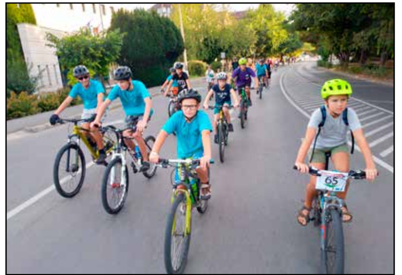
Körbeciklizték Tamási utcáit

Az egy hetes rendezvénysorozat megszervezésében a Tamási BringaSport Egyesület működött közre, és programból nem volt hiány, ugyanis összesen 11 különböző, kerékpározáshoz köthető eseményt bonyolított le a szervezet. Reggeli bringázás, kerékpártúra, kódkereső játék, futópályázat, ügyességi verseny, bringás reggeli, autómentes nap és kerékpáros felvonulás is volt a programok között, melyeken a legkisebb és a legidősebb korosztály is megjelent, összesen több száz résztvevőt sikerült megmozgatnunk.