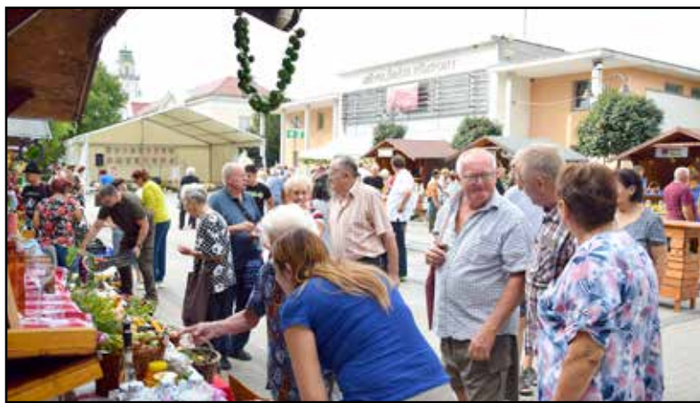
Tizenhét település állította ki termékeit idén