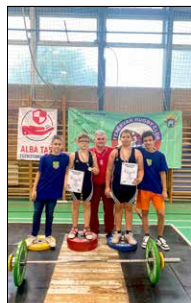
Szép helyezésekkel tértek haza a versenyről

Gratulálunk versenyzőink derekas helytállásához és eredményeikhez!