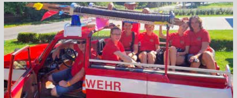
Wurzenben jártak az önkéntes tűzoltók

A megnyitó rendezvény keretein belül Marcel Buchta főpolgármestertől egy kedves ajándékot kaptunk, ami egy német-magyar zászlókat formáló kitűző volt; ezzel is szentesítve a barátságunkat és a partnerkapcsolatunkat. Az ínycsiklandóan finom, magyar, frissen készült lángossal mosolyt tudunk csalni a vendégek és nem utolsósorban tűzoltó bajtársaink arcára is. Ahogy mi nevezzük magunkat „a Magyar Lángos Csapat” visszhangja nagyon jól csengett egész nap. A bevétel természetesen most