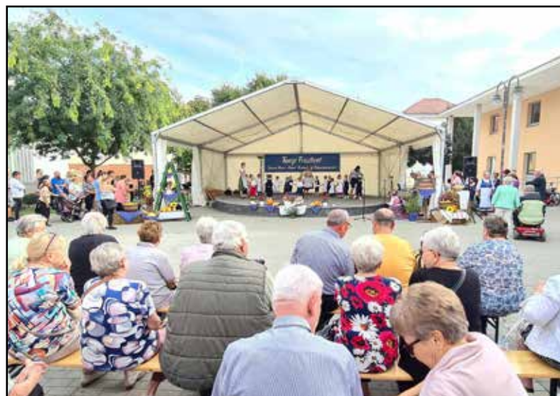
A helyi nemzetiségi csoportok is felléptek a rendezvényen

az eredeti sváb muzsikát, és természetesen modern, német dalokkal is készültek. – Ebben az évben meglátogattunk minket Wurzen város 2022-ben megválasztott főpolgármestere, Marcell Buchta és delegációja is, nagyon jól érezték magukat – folytatta Gutheil Magdolna. – Nem csak a kilátogató felnőtteknek kínáltunk színes programot, hanem a gyere-