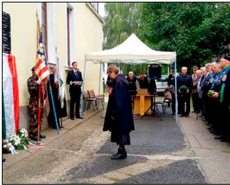
Koszorúzással zárult a rendezvény

A Himnusz elhangzása után Lévai Miklós nyugállományú alezredes, a Honvéd Hagyományörző Egyesület elnöke lépett a résztvevők el, hogy megtartsa ünnepi beszédét. Mint hangsúlyozta: a magyar nyelvben vannak olyan szavak, melyeket nem lehet más nyelvekre lefordítani. Ezek közé tartozik az édesanya, a haza, a honvéd és a vitéz szó is. Utóbbi megnevezés történelmi gyökerekkel rendelkezik, hiszen azokat illette, akik vitézül szolgálták a hazát. Nem véletlen, hogy az egyenruhát viselő személyek, azaz a katonák a „vitéz úr” megszólításban részesültek. Magyarországon az első világháború után, 1920 és 1945 között működött a vitézi rend, mely szervezetnek Horthy Miklós kormányzó volt az alapítója és főkapitánya; az ország vezetője a Magyar Királyi Honvédség főparancsnoka is volt. A rend tagjai pedig azok lehettek, akik