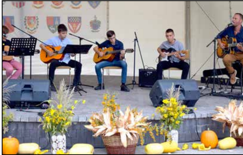
Fellépők is színesítették a programot

Porga Ferenc, Tamási polgármestere köszönetét fejezte ki annak a 17 önkormányzatnak, akik elfogadták a meghívást, és kiállították termékeiket a Túrmezei téren. Mint mondta: a nehézségek ellenére értelmes, értékes és hasznos munkát végeznek a közfoglalkoztatottak. – Sem a koronavírus, sem az energiaválság nem törte meg a lendületet – mondta a polgármester. – Akadnak persze belső nehézségek, például az, hogy a közfoglalkoztatottak száma egyre csökken. Ez ugyanakkor jó hír is, hiszen azt jelenti, hogy a program elérte a célját, vagyis a közfoglalkoztatottak egy jelentős része az elsődleges munkaerőpiacon talált magának álláslehetőséget.