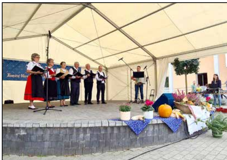
Sváb dalokkal készültek a kórus tagjai