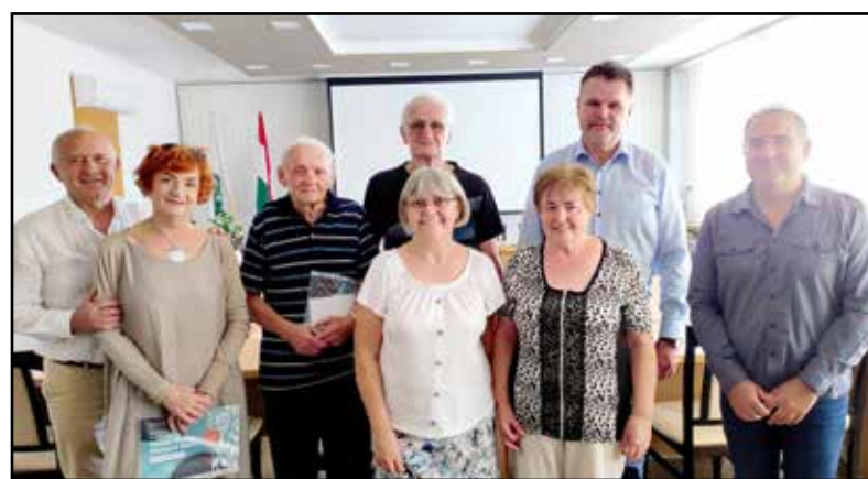
A polgármesteri hivatalban adták át a nyereményeket

A program lezárására szeptember 26-án, a polgármesteri hivatal dísztermében került sor, ahol a családi ház, társasház, lakásszövetkezet és sorház kategóriában a nyertesek: