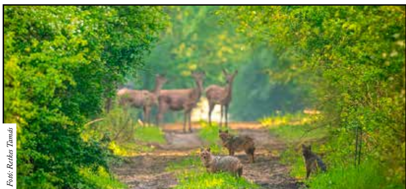
Sakálok és szarvasok egy fotón

ról mesélt, hogy sakálokat is sikerült fotózni. Aznap a Gemenc egy kereszteződésben ült le, ahol négy nyiladékot is belátott. Az előtte lévő nyiladékban mindig lát mozgást, több szarvasos, vaddisznós fotója is azon a helyen készült. Egyszer csak mozgásra lett figyelmes és két sakált látott meg, amelyek kiváltak az erdőből. Elkezdte fotózni őket, majd nem sokkal utánuk kijött a harmadik, kicsit sötétebb színű sakál is. - Fotóztam már ko-