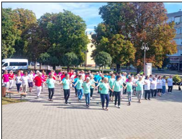
Ismét megtelt a Túrmezei tér táncosokkal