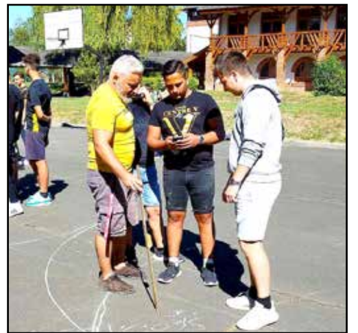
Műszaki rajz szerkesztés nagyban

Az idei évben a szeptember első hetében lezajlott Iskolafoglaló napok keretében motivációs rövid kisfilmeket készítettek a diákok ágazatonként, melyeket a későbbiekben az iskola pályaaorientációs programjai során tud használni, betekintést nyújtva a pályaválasztás előtt álló tanulóknak az egyes ágazatok szakmaiba, azok rejtelseibe. Az építőipar ágazat motivációs kisfilmje az ágazati és a szakirányú oktatás