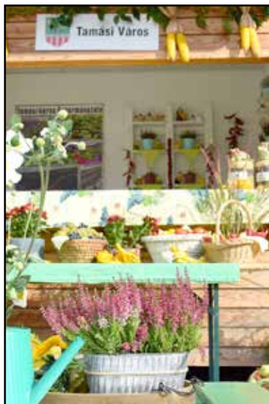
A tamási stand az ősz színeiben

2014-ben Tamásiban 220 közfoglalkoztatott volt, ma már kevesebb, mint 60, és a környékbeli településeken is nagyjából ez a tendencia látható. Az érintett önkormányzatok alkalmazkodtak ehhez a helyzethez; a leghasznosabb, legértékesebb, legpiacképesebb programokat viszik tovább, azokban dolgoztak az elmúlt időszakban is. A kiállított termékek értékét növeli, hogy kézzel készültek, nagyrészt helyi termékből, helyi alapanyagból, ezzel a munkával a közfoglalkoztatottak a környezetüknek és önmaguknak is bebizonyították, hogy értékkeremtő, hasznos munkát tudnak végezni. Abban vagyunk érdekeltek, hogy a kialakult jó gyakorlatok, tudás, tapasztalat megmaradjon a településen, és az itt élők érdekeit szolgálja a továbbiakban is – hangzott el Porga Ferenc beszédében.