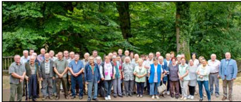
Kellemes hangulatban telt idén is a találkozás

A nyugdíjas kollégáink a cég szervezésében biztosított buszokkal érkeztek, így azok is el tudtak jönni, akik saját szervezésben, vagy nehezebb mozgással, vagy autóval nem tudtak volna, többen a „sofőr feladattól” mentesülve mindemellett megkóstolhatták a helyi bort is. Örömmel tölt el minket, hogy a népszerű rendezvényeinkre mindig nagy az érdeklődés és magas létszámú a részvétel, és külön öröm, hogy szinte mindenki eljött a „frissen” nyugdíjba mentek közül is. A nyugdíjasaink látható örömmel és várakozással érkeztek, a korábbi éveknél is jobb kedvvel, sok nevetéssel, szeretettel üdvözölték egymást. A rendezvényt Góbbölös Péter, a Gyulaj Zrt. vezérigazgatója nyitotta meg köszöntő beszédével, és egy átfogó tájékoztatással a részvénnytársaság utóbbi