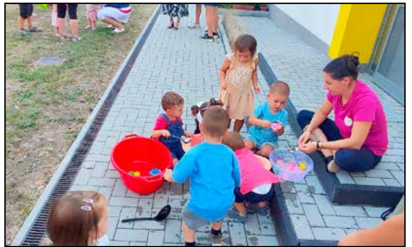
A legkisebbek ismerkedtek az intézménnyel

A megszokottnál is népesebb volt játszóudvarunk szeptember 6-án délután. A 2023-2024-es nevelési-gondozási évben beiratkozó közel 40 kisgyermek és szülei, nagyszülei, testvéreik barátkoztak a legkisebbek intézményével – a bölcsődével. Igyekezünk változatos játéklehetőségeket biztosítani a kisgyermeknek, bepillantást engedni foglalkozás-kezdeményezésünk palettájába. Lehetett halacszkákat horgászni, merőkanállal, tölcser-