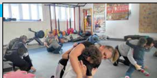
Ezúttal az anyukákkal edzettek közösen a gyerekekkel

A csoportban végzett munkán a fő hangsúly az odajáró gyerekek tehetséggondozásán van, ugyanakkor fontos szerepet kap, mintegy kiegészítésként az, hogy az edzésekre járó gyermekek szüleit is időről időre