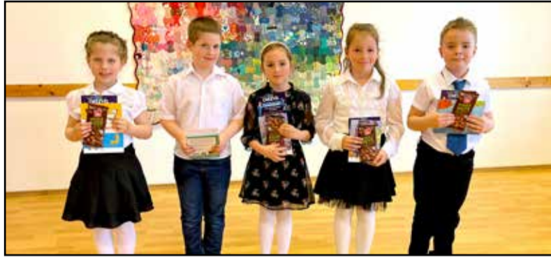
Az I.-II. évfolyam helyezettei

A verseny a „Meseszámok bűvöletében” címet kapta, melyre olyan szabadon választott mesékkel nevezhettek a gyermekek, amelyekben szerepelnek meseszámok. A térségi és az helyi általános iskolák legjobb mesemondóit köszönthettük a rendezvényen. Az első napon a 1-2. évfolyamosok megmérettetésére került sor, míg a második napon a 3-4. évfolyamosokéra. A mesék tárházában, illetve a mesei fordulatok között rengeteg olyannal találkozhatunk, amiben megjelenik egy vagy akár több meseszám is. Így az idei évben a meseválasztás során megannyi lehetőség közül választhattak a nevezők és felkészítőik, többen akár kedvenc meséikkel is érkezhettek az alkalmakra. A délutánok során igazi önfelad