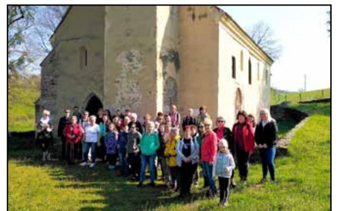
Az idej első túrán sokan vettek részt

a hatalmas rádólt fa. Visszatérve az eredeti útra elértek a Meleg-mányi mésztufa lépcsőhöz, ami a legnagyobb vízesés ezen a területen. A következő útszakaszon a kidőlt fákon való átjutás jelentett némi kihívást a továbbjutásban. Délben pihenőt tartottak és elfogyasztották ebédjüket, majd Nagymély-völgy mésztufa gátjai felé vették az irányt. A többnyire bükk erdő alját szőnyegként borította a medvehagyma. A szűk meredek falu völgyben zúgó patak számtalan kisebb, nagyobb mészkő vagy mésztufa lépcsőn bucskázik le sok-sok vízesést hozva létre. Ez a mesés út végig a patak partján vezet, melyen számtalanszor át kellett