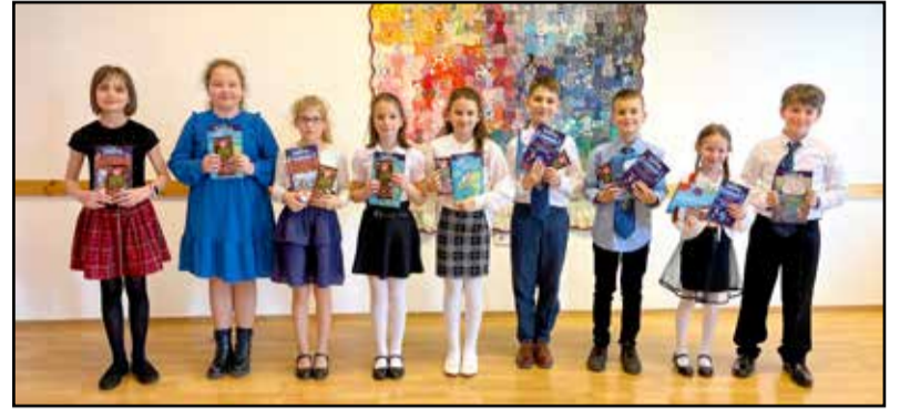
A III-IV. évfolyam helyezettei