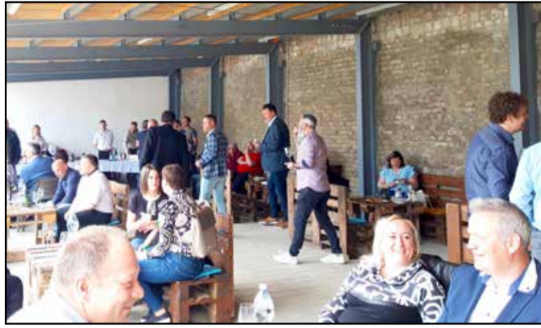
Hét pincészet borait kóstolhatták a vendégek

– A Tamási Szüreti Napokon és a Tolnai Borok Éjszakáján az itt élő és a környékbeli borkedvelők találkoznak a borokkal, viszont ezek mögött az italok mögött nincse-