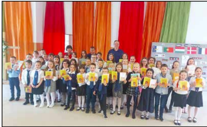
Csoportkép is készült Nagy Bandó Andrással