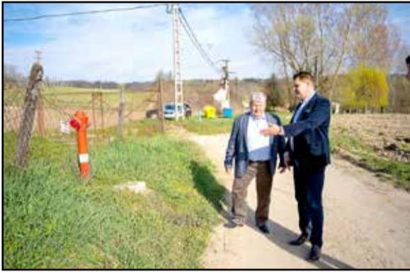
Süli János, a térség országgyűlési képviselője többször is kilátogatott a területre

Kosba, Tuskós, Újvárhegy, valamint Adorjánújtelep, Adorjánpuszta és Öreghegye településrészek ivóvízhálózata épült ki az elmúlt időszakban, a beruházás a végéhez közeledik. A város önkormányzata még 2020 decemberében nyújtott be támogatási kérelmet „Tamási külterületi lakott helyek ivóvízellátásának kiépítése” címmel a „Közép-Duna menti térségfejlesztési feladatok” elnevezésű fejezeti előirányzat terhére. Még abban az évben megérkezett a pozitív pályázati értesítés, a támogatói okiraton 436.530.000 forint támogatási összeg szerepelt. - A támogatási kérelem beadásakor, 2020-ban több olyan településrésze volt Tamásinak, ahol nemhogy nem volt megfelelő minőségű ivóvíz, de vezetékhálózat sem állt rendelkezésre – fogalmazott a város polgármestere, Porga Ferenc. - Mivel kötelez minket a csatlakozási szerződésben az ivóvízes szakterületen vállalt derogációs kötelezettség, annak érdekében, hogy ezen feladatát az önkormányzat teljesíteni tudja, ki kellett építeni a hálózatot, amelynek költsége meghaladta az önkormányzat anyagi lehetőségeit. Állami vagy uniós forrás biztosítása nélkül, tisztán saját forrásból a beruházást nem tudtuk volna megvalósítani. Ko-