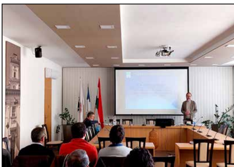
A lakosság is feltehetette kérdéseit a fórumon

Az önkormányzat az adatszolgáltatást teljesítő, érintett háztartásokat hívta lakossági fórumra, melyen a tájékoztatás mellett a kérdések megvitatására is sor került.