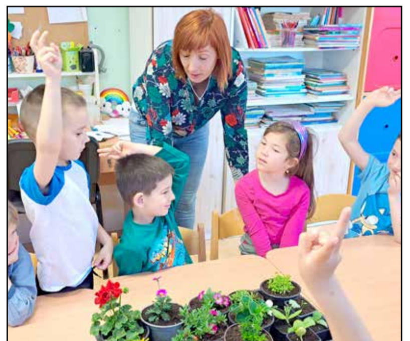
A virágok gondozásáról is szó esett

A hét folyamán nagyon sok alkotás, produktum készült, amelyet gyűjtőmunka előzött meg (gyűjtöttünk: WC papírgurigákat, műanyag flakonokat, színes kupako-