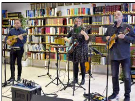
Megzenésített verseket hallhatott a közönség

A Könyv László Könyvtárban e nap délelőtti mindig a kisiskolásoké, akik osztálykeretben érkeznek hozzánk és forgószínpadszerűen – egyénileg vagy csoportosan – elszavalják kedvenc versüket. Idén ez a szavalónap a tavaszi szünet miatt egy héttel későbbre csúszott. Több száz gyermekvers hangzott el a