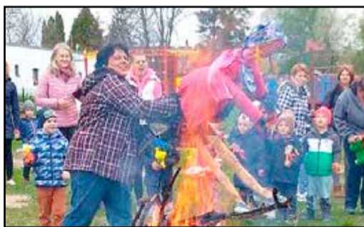
Elégették a Kiszé bábót

Március utolsó hetében minden évben visszatérő hagyományt valósítottunk meg, a KISZE NAPOT. Az egész hét a népszokás éltezéséről szólt, a kiszézéshez kapcsolódó mondókáktól, énekektől, rigmusoktól volt hangos a lelkes gyermekereg.