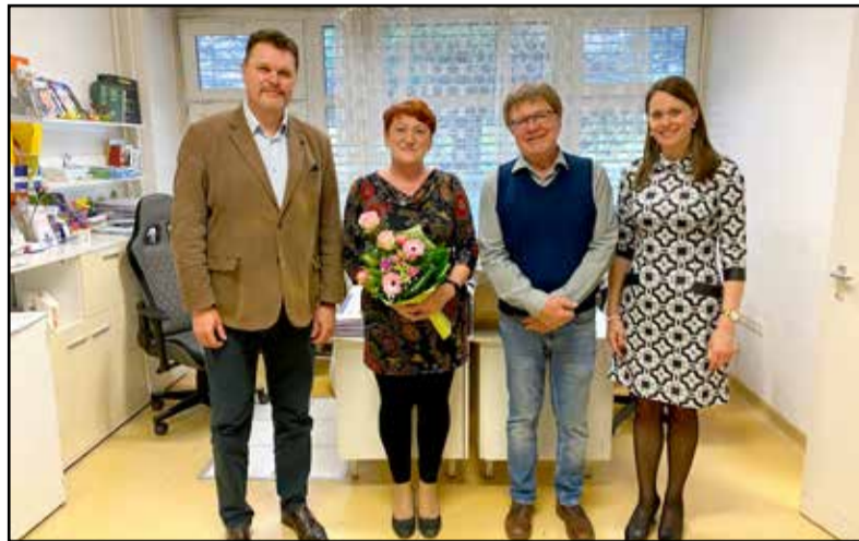
Az utolsó munkanapok egyikén a városvezetők is elkészöntek

– Minden teljesen másként működött régen. Más volt a kapcsolat a betegekkal. Valószínűleg, hogy a digitális világ hozza ezt magával, de én úgy látom, hogy tönkreteszi az empátiás kapcsolatokat. Számomra személytelemmé vált az egész, hiszen már a recepteket is online írjuk. Az utóbbi öt évben nehezebb lett a betegek sorsa is, nehéz elhelyezni őket, mert kevés az orvos. Ha nekem háziorvosként tovább kellett küldenem valakit szakrendelésre, vagy kórházba, akkor sokszor falakba ütköztem már. Régen, ha egy kollégát felhívtam, hogy van egy eset, ki kellene vizsgálni, azt mondták, rendben, küldjem holnap vagy holnapután. Most azt mondják, persze, küldjem, csak ne hozzájuk. Kevés az empátia, a törődés ebben a felgyorsult világban, és persze a szakember is. Mikor idekerültem, sokkal többet jártunk ki házhoz. Ha például délutános voltam, reggel felkeltem, volt egy cetlim, és a korábbi hívásokat láttam el, 4-5 beteget meglátogattam, beleértve a külterületen élőket is. Az idők közül sajnos sokan már elmentek, kevesebb lett a hívás, ma már a mentő megy a sürgős hívásokra. Egy-egy napi műszaki is zsúfoltan alakult, 8 órákor kezdünk és délután 1-kor fejeztük be, de ez hiába 5 óra, rettenetesen tömény volt. Itt nincs ritmus, minden 5-10 percen bejön valaki, azonnal váltani kell, diagnózisra törekedni, ellátni, vagy épp tovább küldeni. Tizenkét évvel ezelőtt még mi ügyeltünk éjszaka is, hetente két alkalommal legalább, másnap pedig egy gyors reggeli után ugyan-