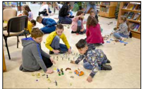
A gyerekek ki is próbálhatták a játékokat

Megszámlálhatatlanul sok játéka volt, például Moszkvics, búgócsiga, böngös boci és a hozzá hasonló műanyag játékok, Moncsicsi minden méretben, Skála Kópé, porcelán babák, társasjátékok, köztük