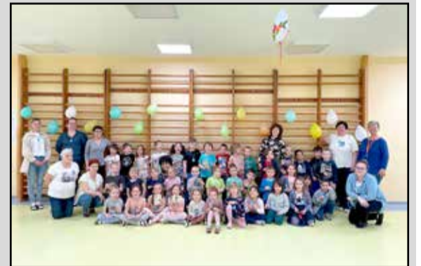
A vízről tanulhattak a gyerekek

Földünkhöz kapcsolódó minden nevezetes napról megemlékezünk, így került sor a víz témakörének, a víz világnapjának megünneplésére, melyet témahét keretében valósítottunk meg a március 20-ai héten. A témahét