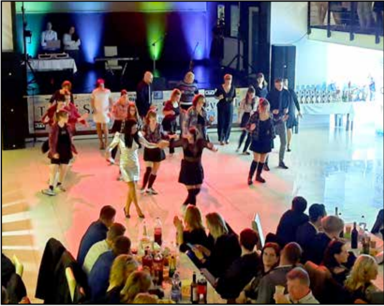
A Dancing Family táncolni hívta a résztvevőket

A pandémia két év kényszerpihenőre küldte a város egyik legnépszerűbb bálját, a Sportbált. Idén vége nem gördült akadály a megrendezése előtt, így ismét több mint háromezren buliztak együtt március 25-én.