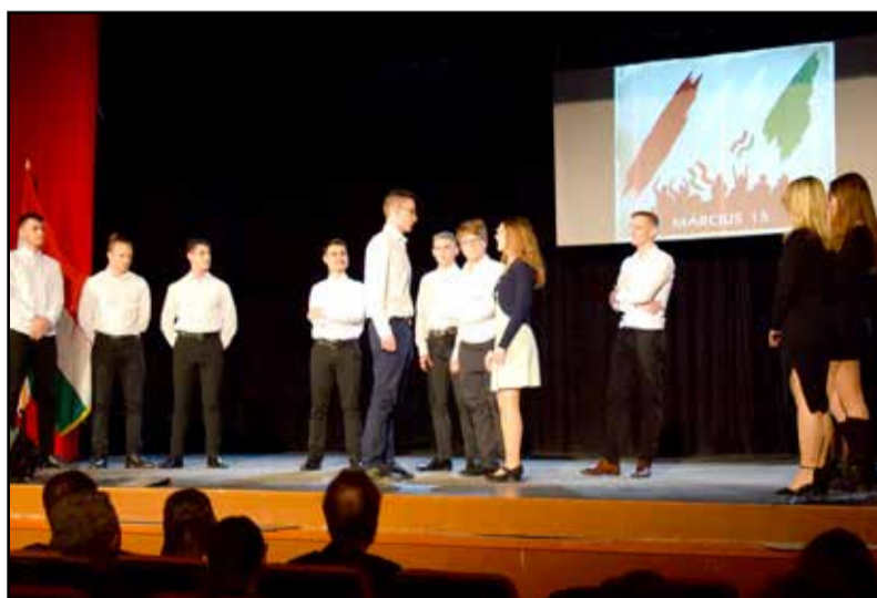
A gimnázium tanulójának műsora