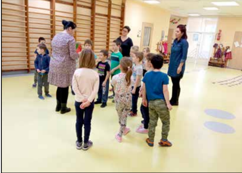
A leendő elsős tanítónénikkel ismerkedhettek a gyerekek

A hatéves gyermek életében óriási fordulatot jelent, hogy iskolába kerül. Gyökeresen megváltozik, átalakul az élete. A szülők és mi, pedagógusok is tudjuk, hogy az óvodás évek döntően befolyásolják a gyermek attitűdjét az iskolával kapcsolatban.