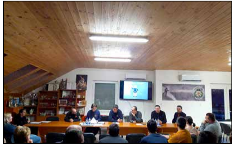
Az önkormányzati és az önkéntes tűzoltók is megtartották beszámolóikat

Kardinális kérdés a tűzoltóságon a gépjárműfecskeállapot. A parancsnok elmondta: két gépjárműfecskeállapotmal rendelkezik, egy Steyr és egy Mercedes típusúval, előbbi a 30-as évei felé jár, utóbbi 40 éves is elmúlt. Mindkét jármű a folyamatos karbantartás ellenére is öregszik, sok hibájuk van, és az alkatrész beszerzés nagyon nehézkes a korukból adódóan, tehát szükséges a cseréjük. Újonnan akár 200 millió forinttól is indulhat egy gépjárműfecskeállapot, ám használtan, külföldről már 40-50 millió forint