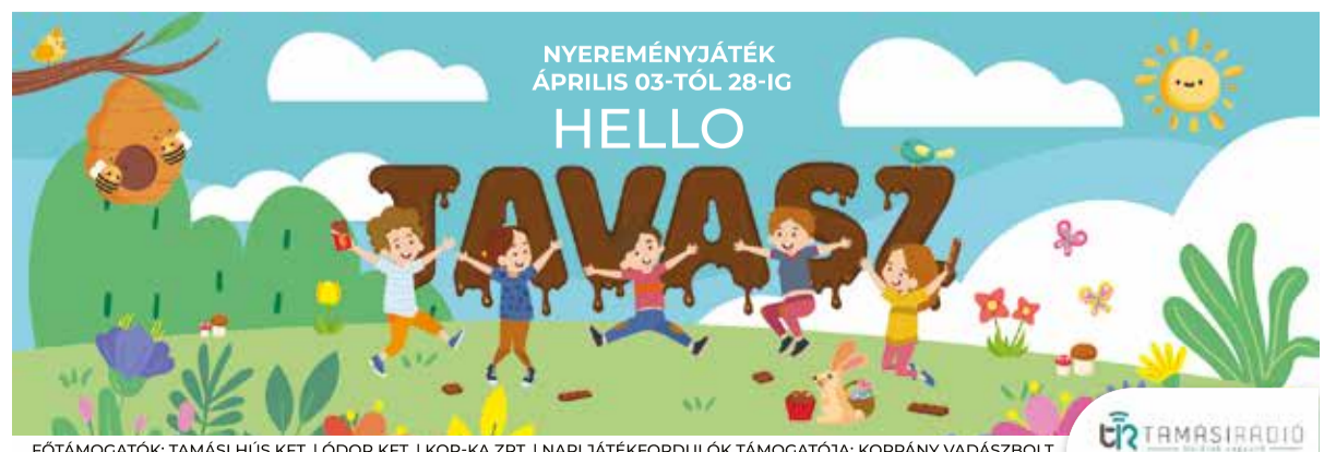
FŐTÁMOGATÓK: TAMÁSI HÚS KFT. | ÓDOR KFT. | KOP-KA ZRT. | NAPI JÁTÉKFORDULÓK TÁMOGATÓJA: KOPPÁNY VADÁSZBOLT

vettük, hogy a leendő óvodás szülők nagy számban elfogadták a meghívást és megtisztelték Bennünket jelenlétükkel. A fórum folytatásaként, nyílt napot szerveztünk a kiscsoportosokat fogadó csoportokban, március 21-én. Az óvo nénik izgalommal, és szeretettel várták a csöppségeket és a szülőket. Az érkező vendégek betekintettek és részt vehettek az óvodás csoportok délelőtti tevékenységeiben, játszhattak, együtt mozoghattak, énekelhettek óvodásainkkal.