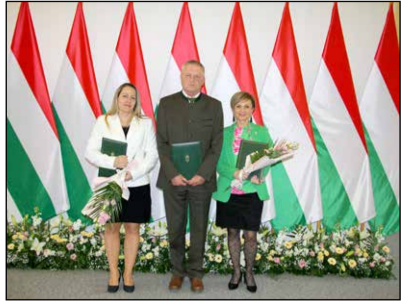
A Gyulaj Zrt. munkatársai

Az erdő egységes rendszer, amely sérülékeny, védelemre szorul. Közös felelősségünk, hogy megértsük és tudatosítsuk: teremtett világunkkal együtt élve, abban a lehető legkevesebb kárt okozva, ökológiai egyensúlyát fenntartva kell léteznünk, hogy utódaink is megismerhessék ezt a csodát – fogalmazott Farkas Sándor a 2023. évi Erdők Világnapja alkalmából rendezett kitüntetési ünnepségen. Az Agrárminisztérium miniszterhelyettese Budapesten, a Vajdahunyadvárban rendezett eseményen úgy fogalmazott: az erdőt ismerő és szerető ember jól tudja, mennyire szervesen és harmonikusan kapcsolódnak egymáshoz a teremtett világ élőlényei. Az erdők, a fák tevékenyen részt vesznek az UV-sugárzás szűrésében, a szálló por, a széndioxid és a talaj megkötésében, a levegő tisztításában, a víz raktározásában, a lokális klímaszabályozásban. Közben élőhelyet, táplálékot biztosítanak az erdei állatoknak. Az erdő maga az élet. A természet és a titkok birodalma. Az erdő létezése nem magától értetődő. Az erdőgazdálkodók, vadgazdálkodók tudják a legjobban, hogy tudatosan kell törekednünk megőrzésükre, és tudatosan kell hasznosítanunk az erdők ökoszisztéma-szolgáltatásait. Ismerni és érteni kell az erdőt, ahogyan Önök is teszik – szölt az ünnepségen jelenlévő szakemberekhez a mi-