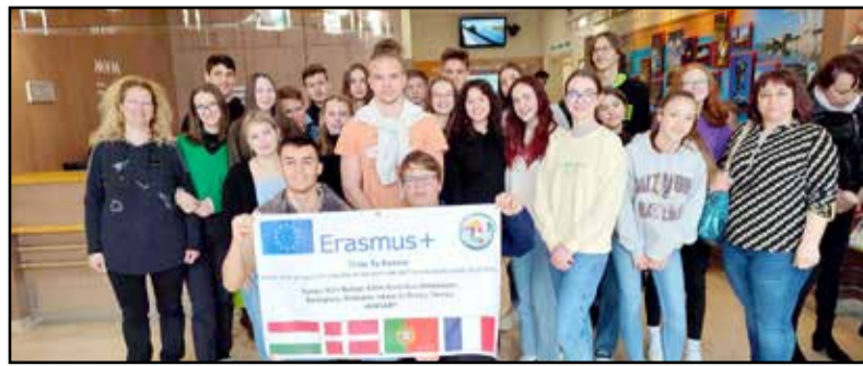
Újabb Erasmus programban vehetnek részt a gimisek

A vasárnap a fogadó családoké volt – valójában a többi is, csak ezen a