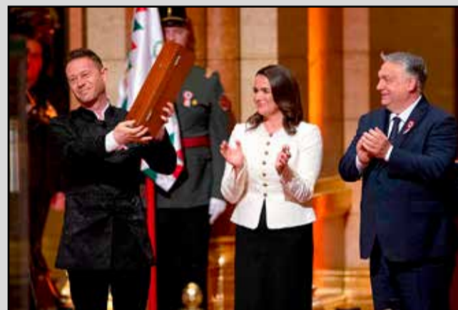
Orbán János Dénesnek Novák Katalin és Orbán Viktor is gratulált

A brassói születésű Orbán János Dénes, a magyar állam támogatásával működő Előretolt Helyőrség Íróakadémia vezetője, a kormánypárti Magyar Nemzet kulturális rovatának korábbi vezetője, Babérkoszorú és József Attila-díjas költő, prózaíró, a Magyar Művészeti Akadémia levelező tagja. Magyarország számára kivételesen értékes művészi pályafutása során a kortárs magyar irodalmat egyedi stílusú, formailag és nyelviileg is bravúros költeményeivel, prózáival és drámáival gazdagító írásművészete, valamint példaadó irodalomszervező és tehetséggondozó tevékenysége elismeréseként kapta a Kossuth-díjat, idézi az indoklást az MTI. Az erdélyi származású Orbán János Dénes 2014-ben költözött Tamásiba, azóta városunkban él, 2022-ben Tamási Város Díszpolgárának választották. Az irodalmi színrelépés óta sok elismerést kapott, a kérdésre, hogy ezek között mit jelent számára a Kossuth-díj, így fogalmazott: „Ó, hát csak úgy csöndeskén, klasszikusan azt, hogy fölértem a csúcsra. Nem fogok sem szerénykedni, sem valami alternatív maszlagot megfogalmazni: nagyon, de nagyon örülök, és megtisztelve érzem magamat.” A Tolnai Népújságnak azt mondta: „Az elismerés, megismétlem, azt jelent számomra, hogy fölértem a csúcsra. Am még innen is van feljebb, mert a csúcs fölött