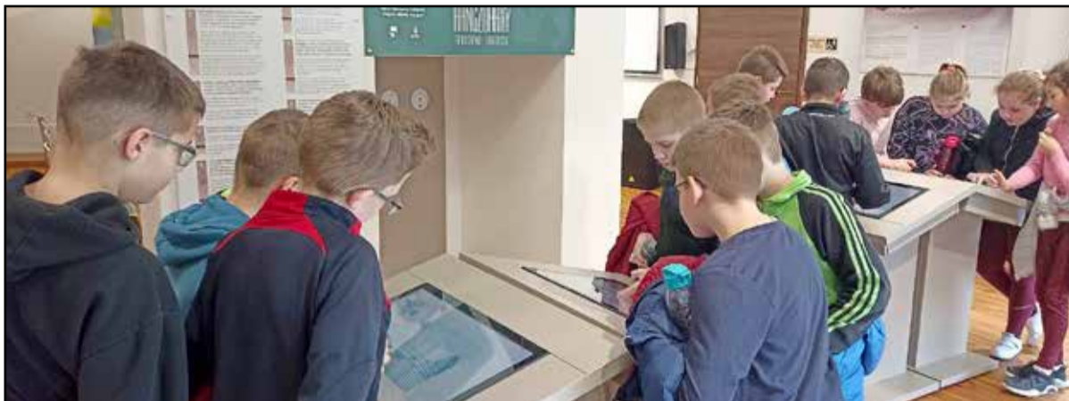
A gyerekek a látogatóközponttal ismerkedtek

A tavasz beköszöntével nem csak az időjárás csalogatja ki a családokat, gyermekeket a szabadba, hanem a programok is. A DámPont Látogatóközpont márciusban több lehetőséget kínált, és a következő hetekben is számíthatunk eseményekre.