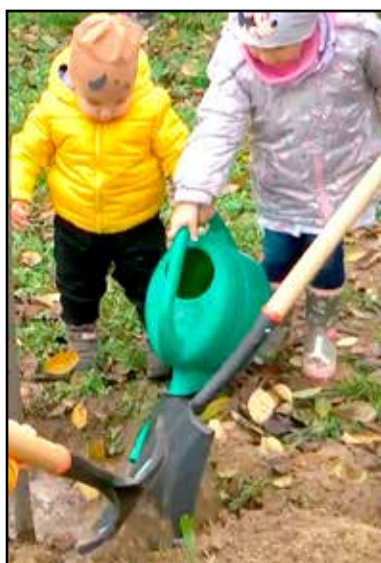
A legkisebbek is segítettek