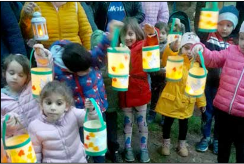
Színes lámpások készültek Márton napra

A Márton nap a jeles napok egyike, amit a gyermekek és a szülők egyaránt, minden évben már nagyon várnak. Óvodánkban egyhetes előkészület előzte meg a sikeres napot.