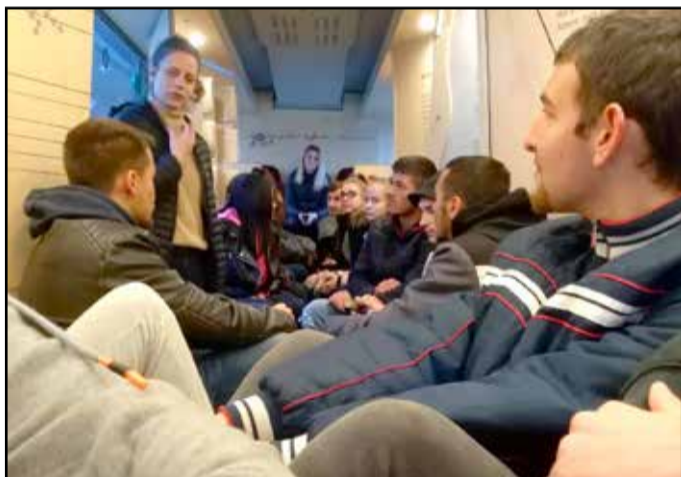
Vályisok a Petőfi buszban

A Petőfi Irodalmi Múzeum új vándorkiállítása szeptember 1-jén indult útjára, amely a Petőfi Sándor-émlékév alkalmából jött létre „Átröpülök hosszában hazámon” mottó alatt. A múzeumbusz első állomása a költő szülővárosa, Kiskőrös volt, amelyet közel egy éven át számtalan további település követ majd. Az egyedi megközelítésből felépített kiállítás képzeletbeli utazásra hívta a látogatókat: 1845-ben felszálltak a gyorszekérre Petőfi mellé, hogy a költő a „változó szerencse szekerén” felidézze múltjának meghatározó állomásait, és a résztvevőkkel együtt fürkészze jövőjét. A kiállítás gerincét tíz