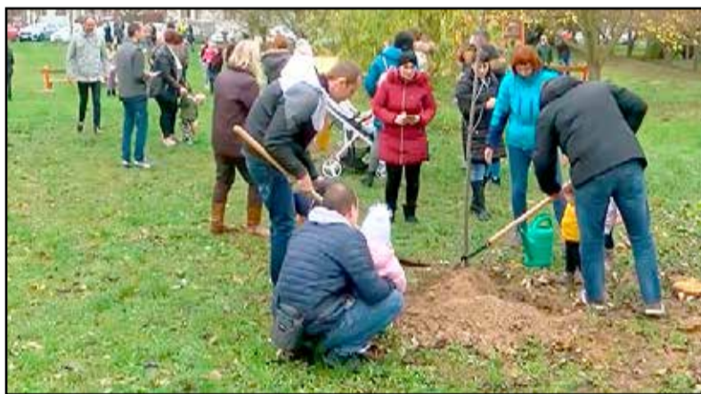
A szülők, nagyszülők, gyermekek közösen ültettek

Hosszú évek hagyománya már Tamásiban, hogy minden év őszén az előző évben született gyermekek tiszteletére fákat ültetnek. Szülők, nagyszülők természetesen a gyermekekkel közösen ültették el idén a vörös levelű juharokat.