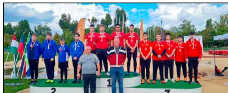
Magyar Csapatbajnokok kalapácsvetésből