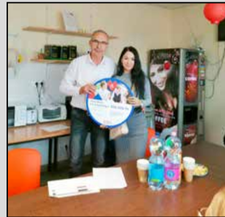
Százezer forintot jelent a helyezés

A tamásiak projektjének neve: Generációk összefogása – mezítalás ösvény kialakítása. Meztalás ösvényt terveznek kialakítani Tamási városában egy olyan intézmény udvarán, melynek fő tevékenysége az idősek és a nehéz sorsú gyermekek segítése, támogatása. Így szeretnék megszüntetni a korosztályok közötti kommunikációs szakadékot és a kialakult sztereotípiákat. A szociális központ nyitvatartási idején belül minden érdeklődő megtekinthetné és használhatná az elkészült kertészeti látványosságot, amely lehető-