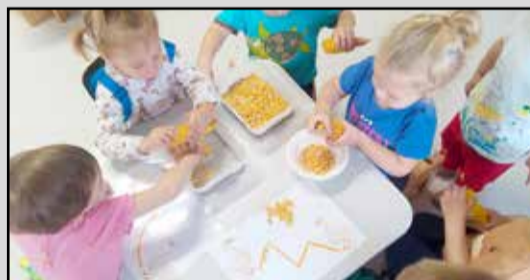
Kukoricát is morzsoltak a gyerekek