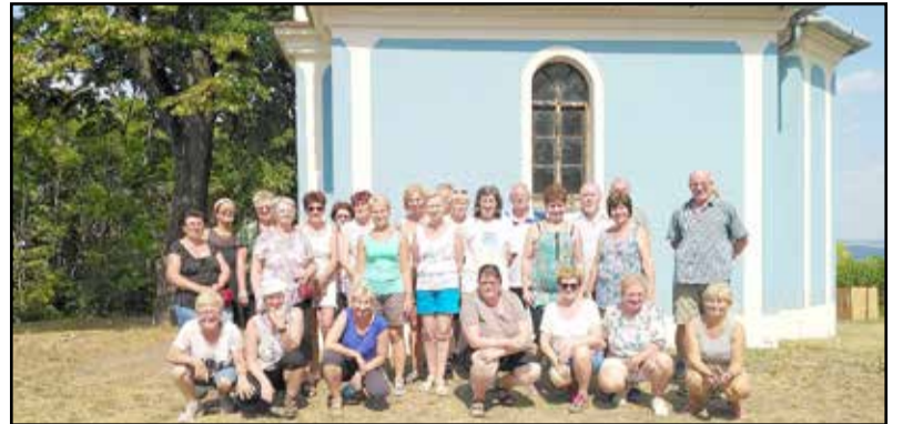
Élményekben gazdag volt az augusztusi túra is

frissithette magát a helyi vendéglők valamelyikében. Hazafele még egy rövid időre megálltak a Görögszó feletti magaslaton álló, égszínkéék Mausz kápolnánál, ahonnan ismét szép panoráma tárult eléjük.