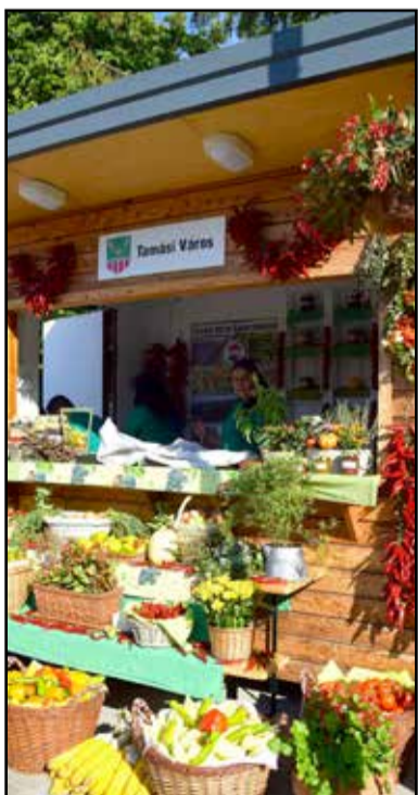
Tamási standja a termékbörzén

lalkoztatási programok sikere mára vitathatatlan. Fontos megemlíteni azonban, hogy a programok indulásához képest mára sok tekintetben megváltozott a helyzet. Munkanélküliségről már ebben a térségben is csak papíron beszélhetünk,