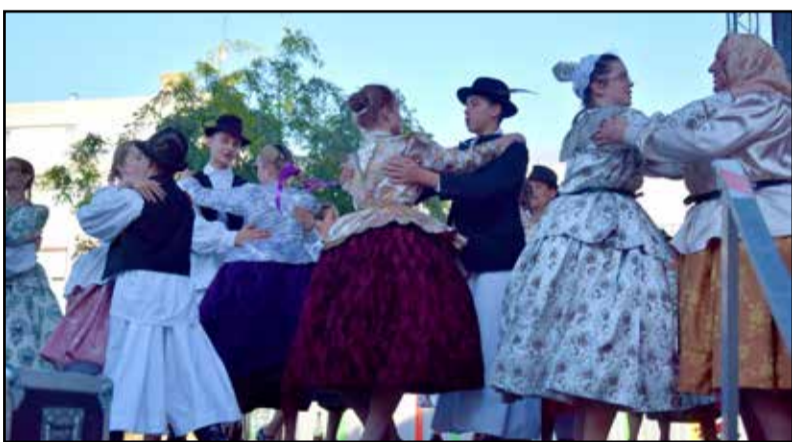
A Pántlika néptánc együttes is fellépett

A két napos rendezvényt a Midnight Boogie zenekar utcabálja zárta. Ahogy egyéb programjaink során, most is érzékelhető volt, hogy a hosszú bezártság után mennyire jól esik mindenkinek az együtt töltött néhány óra, néhány nap, és mindenki talán egy kicsit felszabadultabb hangulatban jött el a rendezvénytérre, és nagy örömről jól érezte magát.