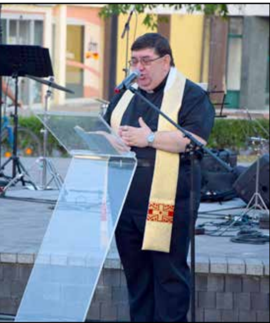
Augusztus 20-án mutatkozott be a városnak az új plébános

– Ha olyan közösséget tudnék építeni, amely hívó, katolikus. Önmagában ez persze nem sokat mond, pedig mégiscsak erről szól az egész. Arról, hogy aki eljön a templomba, az azért jöjjön, mert neki van rá igénye, nem azért, mert szokás vagy hagyomány írja ezt elő. Sok vonatkozásban ezek néha a legnagyobb akadályaink, úgy gondolom. Az idősebb korosztály fejében, minden bántás és sértés nélkül mondom, azok a szokások rögzültek, amikről úgy gondolják, hogy ez hozzá tartozik a hívó élethez.