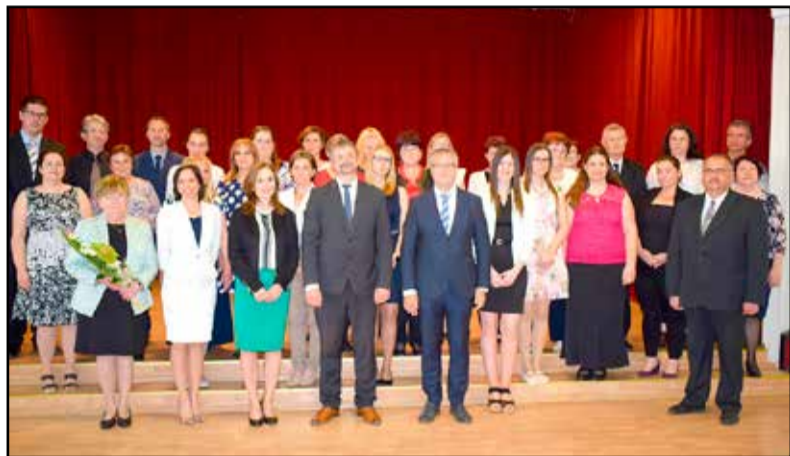
Az elismerésben részesülők

köszöntőjében. A Tolna Megyei Szakképzési Centrum kancellárja a kollégákat méltatva hozzátette, a Centrum és a hozzá tartozó isko-