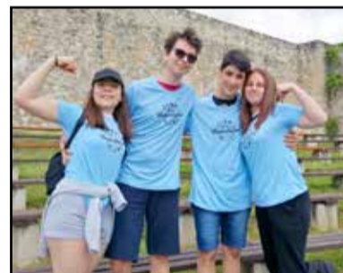
A Lisztes Berkenye csapat tagjai

Az Aktív Magyarországért Programiroda szervezésében ezeknek a táboroknak a résztvevői között hirdették meg a 2020-2021-es tanévben a VándorViadal versenyt. A selejtezőt online fordulóból állt, amelyen nagyon változatos és felforgató feladatok megoldását kellett a lehető legrövi-