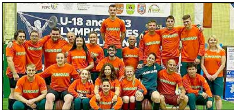
A magyar csapat a 45. Olimpiai Reménységek Versenyén