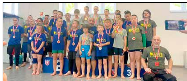
Végre újra versenyezhetek a sportolók

A megmérettetésre Szekszárdról, Szakályból, Iregszemcseről és Nyimből is érkeztek gyerekek, hogy összemérjék egymással tudásukat, és megküzdjenek a dobogós helyekért, éremekért. Nagy öröm volt mindenki számára, hogy két ilyen furcsa tanév után, amikor a gyerekek is hosszú időre elszigetelődtek társaiktól, a négy fal közé szorultak, végre olyan eseményen vehettek részt, ahol önfeledten tehettek olyasmit, ami korábban természetes módon a sportos életmódjuk része volt. Több szülő első alkalommal vett részt nézőként egy ilyen eseményen, így mindannyian élményekkel telítődve tértek haza a nem várt izgalmak után. Csodálatos élmény volt újra megtapasztalni azt,