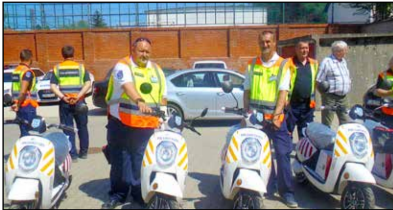
Az új eszközök nagyban segítik a polgárőrök munkáját

Az eszközbővítést a Tolna Megyei Polgárőr Szervezetek Szövetsége hatmillió forintos célzott támogatásból oldotta meg, amelynek köszönhetően új motorok, kerékpárok, laptopok kerültek a tolna megyei polgárőr egyesületekhez. A Tamási Polgárőr Egyesület két elektromos robogót vehetett át.