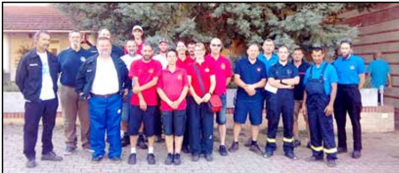
Rengeteg önkéntes indult útnak, hogy segítsenek

Háborús állapotokat hagyott a június 25-ei vihar a Somogy megyei Kadarkúton. A természet évtizedek, de talán évszázadok óta nem látott károkat okozott lakóházakban, melléképületekben, gépjárművekben.