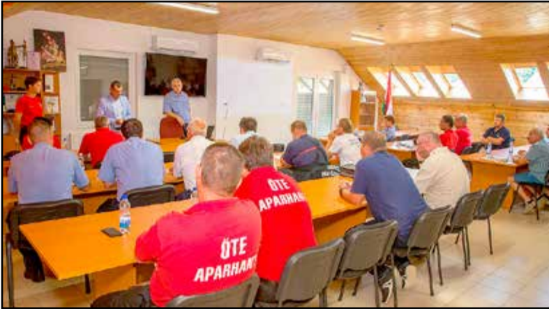
Fontos témákat érintettek a konferencia alkalmával

A Tamási Tűzoltóaktanya adott otthont június 26-án annak a rendezvénynek, melynek keretein belül önkéntes tűzoltó egyesületek és önkormányzati tűzoltóságok képviselői tanácskoztak.