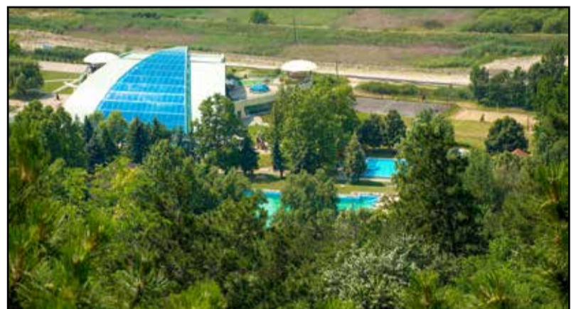
Tamási lett a 39. gyógyhely hazánkban

A minősítés a városnak presztízst jelent, hiszen a hazai települések kis része rendelkezik gyógyhely minő-