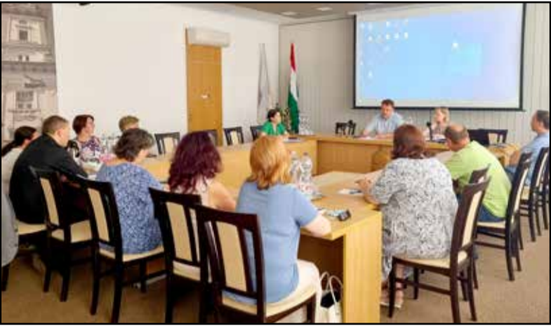
Ismét fontos kérdésekről beszéltek a fórumon

A városháza dísztermében gyűltek össze a város oktatási, nevelési, szociális és egészségügyi intézményeinek képviselői, kiegészülve a kormányhivatal illetékes szerveinek munkatársaival, a kisebbségi önkormányzat, a polgárőrség, valamint a rendőrség képviselőivel.