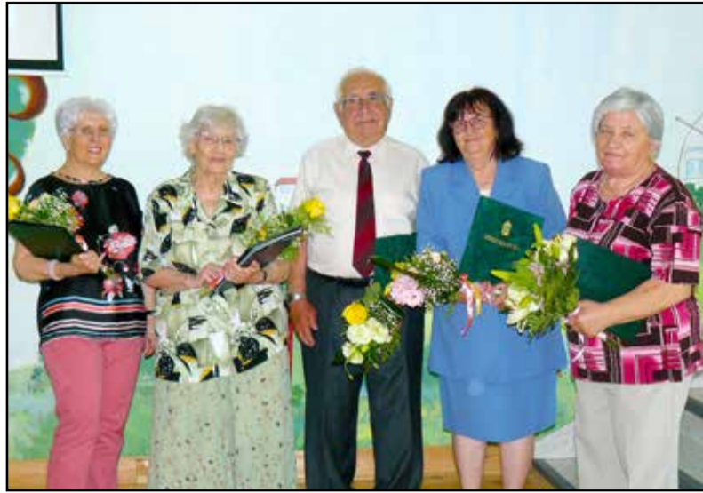
Az ünnepeltek jubileumi diplomájukkal

– Ma újra itt az alkalom, hogy emlékezzetek, idézzétek fel a régi közös beszélgetéseket, történeteket elevenítsetek föl, aztán majd kiderül, ki hogyan emlékszik vissza a lehet nem is olyan régmúltra. Öröm látni, hogy semmit nem változtatok, és az még nagyobb öröm, hogy nem szakította meg a jelenlegi helyzet ezt a szép hagyományt, és itt vagyunk, itt vagytok megint