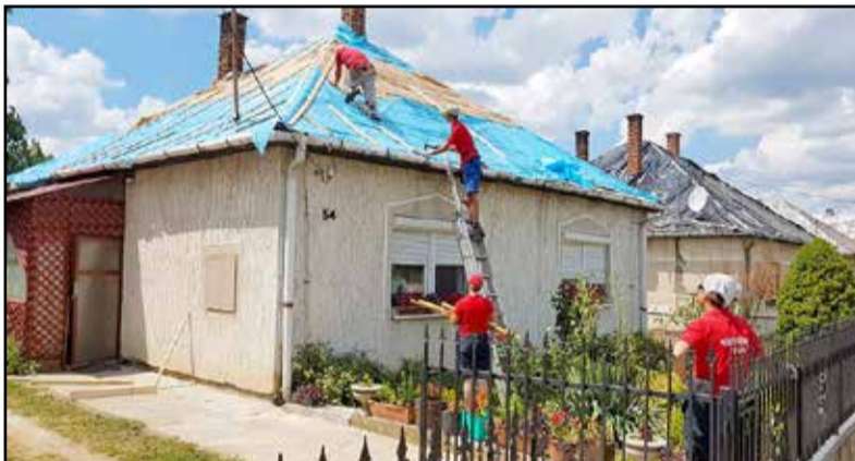
A házak tetőfóliázását végezték el a tűzoltók

ki a katasztrófavédelmi szervezetek, az önkormányzatok, a közigazgatási szervek és a lakosság között. Tamásiban a vihar utáni napon tartottak konferenciát a tűzoltóságon, amikor befutott hozzájuk a segítséget kérő hír. Azonnal szervezésbe kezdtek, és másnap útnak indultak, hogy