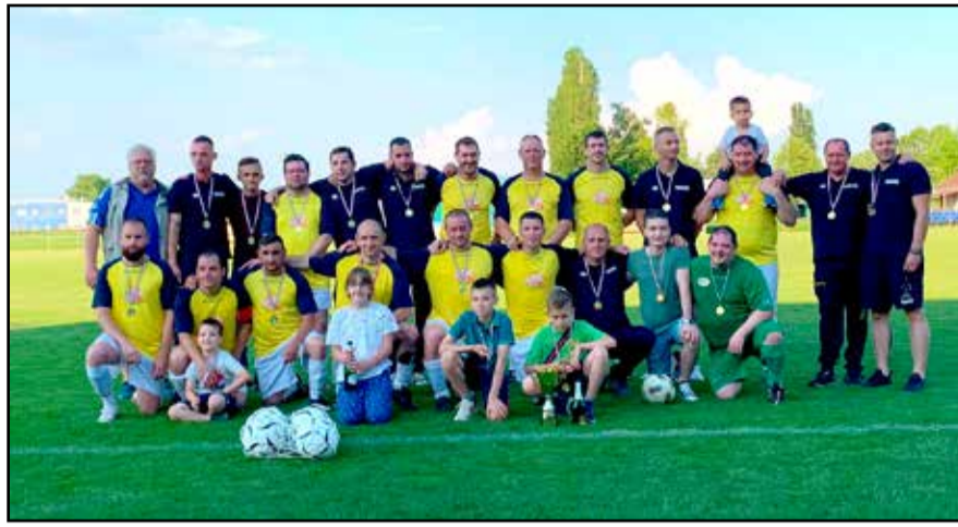
Az aranyérmes csapat