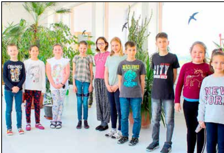
A versenyeken jól szereplő diákok

eredménnyel szerepelnek. Így történt ebben a tanévben is, a Covid okozta nehezített körülmények ellenére. A járványhelyzet miatt online rendezték meg ezeket a meg-