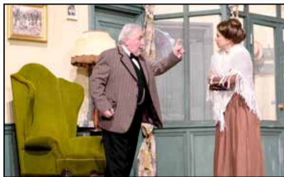
Mikó István és Détár Enikő a színpadon

A darab szereplői között jól ismert művészeket köszönthettünk, a magyar színházi élet meghatározó egyéniségei közül Mikó István, Détár Enikő és Benkő Péter is színpadra állt. Az előadás a Déryné Programmal történő együttműködésünk eredményeként valósult meg, sikeres pályázatunk pedig lehetővé teszi, hogy – a mostanihoz hasonló, rendkívül alacsony jegyárakkal – az év hátralévő részében még több színházi élményben részesüljenek az itt élők. Bepótoljuk a Magyar Nemzeti Táncgyűttes elmaradt, Kárpátok visszhangja című előadását, bemu-