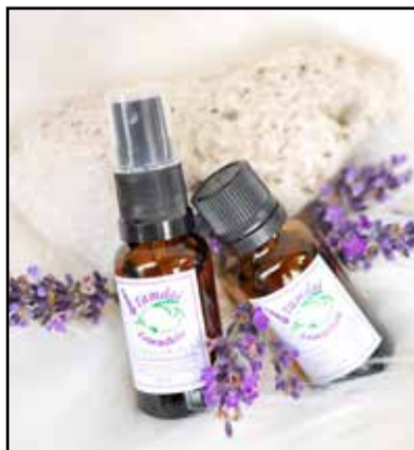
Levendulás termékekkel ismerkedhetnek majd az érdeklődők

Nagy örömünkre már a programokat is elkezdhetjük szervezni. A túraprogramjainkat nagyjából beidőztítettük, kezdésként június 12-