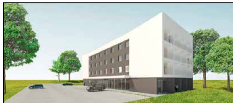
Az épülő munkásszálló látványterve

nehézségekkel küzdenek. Magyarországon 2013 óta erősödnek a munkaerőhiánnyal kapcsolatos vállalati panaszok, növekszik a foglalkoztatási szolgálatnál bejelentett üres állások száma, és emelkedik a vállalati kikérdezésekben mért hiány. A hiánnyal kapcsolatos panaszok tekintetben ma az ország az európai élmezőnyhöz tartozik. „A vállalkozások 42,5%-a rendelkezik betöltetlen állással, a betöltetlen álláshelyek 55%-ára legalább 3 hónapja nem találnak alkalmas jelentkezőt – a legproblémásabb álláshelyekre a válaszadók átlagosan több mint 9 hónapja keresik az alkalmas munkavállalót. Ágazatonként