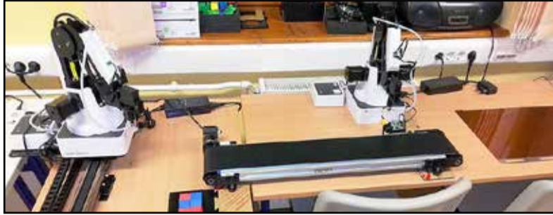
A labor adta lehetőségeket kihasználják a szakmák oktatásához is