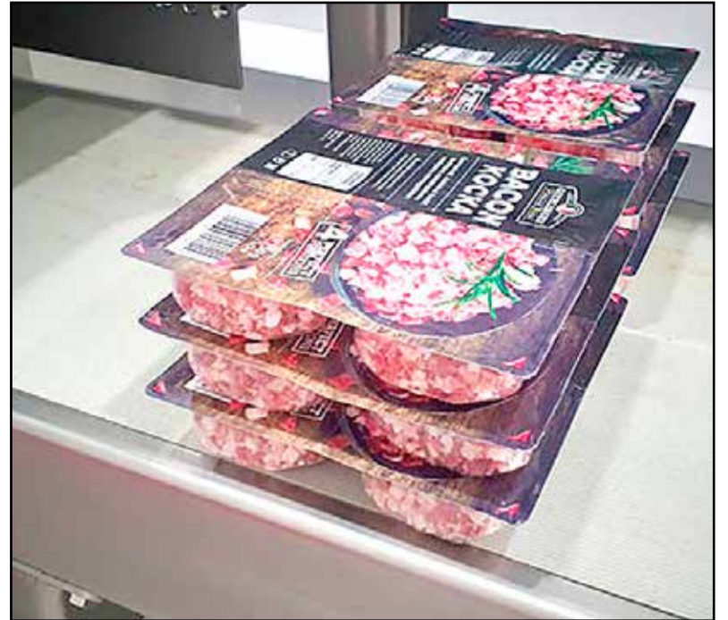
A díjnyertes négykamrás csomagolású Gierlinger Premium kockázott Bacon

– A négykamrás csomagolású Gierlinger Premium kockázott bacon felhasználása azért takarékosabb az átlagos védőgázos kiszerelésű termékekhez képest, mert a frissességet biztosító gázkeveréket négy kisebb csomagolási egységben helyeztük el. Ezáltal rekeszenként felbontva csupán egy adagnyi terméket érint a felbontást követő oxidáció. A Gierlinger