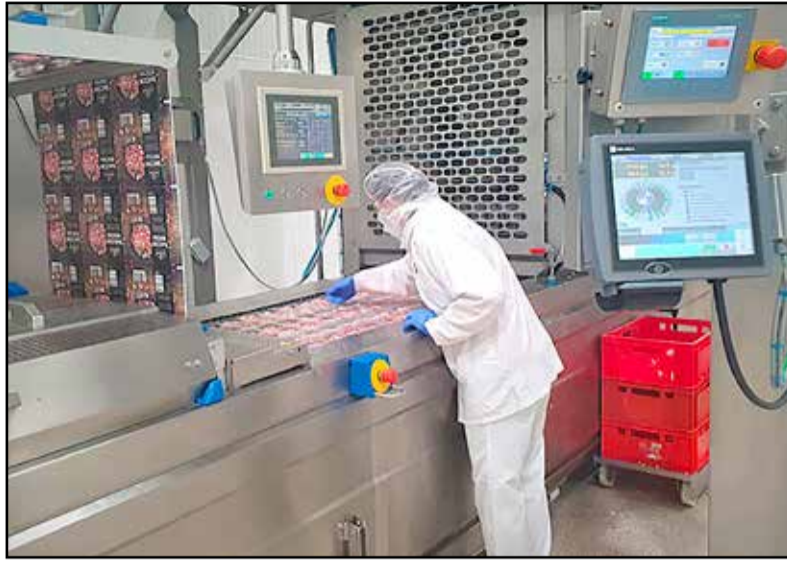
Gyorsabb és precízebb csomagolást tesz lehetővé az új gép

egy olyan nagy volumenű fejlesztést hajtottak végre, amelynek része volt egy automata csomagológép beszerzése is. A csarnokméretű gépsort több nyugat-európai országban is előszeretettel használják, de Magyarországon egyedülállónak számít.