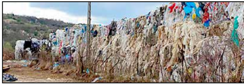
A felhalmozott hulladék aggodalommal tölti el a lakosságot

Több bejelentés is érkezett az önkormányzathoz, és a közösségi oldalon is futótűzként terjedtek a hírek, fotók a városban működő cég hulladékgazdálkodási tevékenységével kapcsolatban. Sok lakos tette szövé a hulladékok tetemes mennyiségű felhalmozását, néhányakat a környezetszennyezés, míg másokat a rágszálók esetleges elszaporodása töltött el aggodalommal. - A Vasút utcai telephelyen működő társaság „nem veszélyes hulladék hulladékgazdálkodási engedély köteles gyűjtése, hasznosítása, ártalmatlanítása” ipari tevékenység végzésére kapott engedélyt, miután