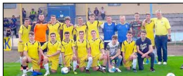
Az U19-es megyebajnok csapat és edzőik

naöldvár ellen (3-3). Ezt követően a forduló meglepetését szolgáltatva 1-0-ra legyőzte ugyan a listavezető és bajnokcsapat Gerjent, azonban a Bátaszék 4-2-es győzelmével, 3 ponttal távozott Tamásiból. A hiá-