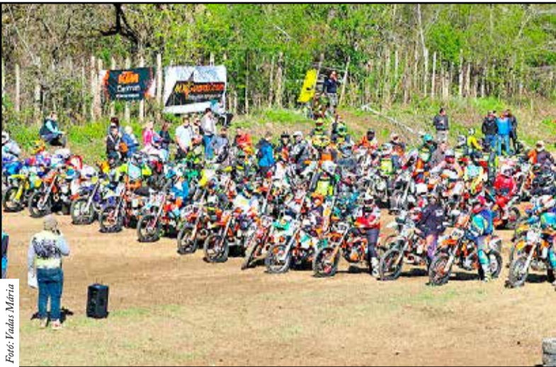
Rekordszámú nevezés érkezett a versenyre

A Magyar EnduroCross bajnokság első fordulóját Tamásiban rendezték meg, április 24-én.