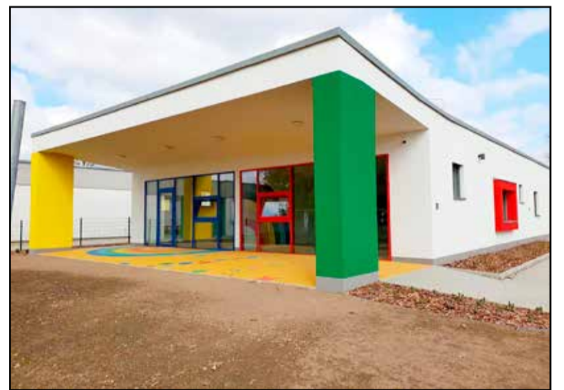
A megújult épület szeptembertől várja a kicsiket

Az idei év szeptemberében új bölcsődei épületrészt adnak át a városban. A bölcsődei férőhelyek száma csaknem megduplázódik a Terület-és településfejlesztési Operatív Program támogatásának köszönhetően.