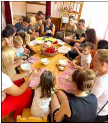
Ígazi közösséggé válnak a családok

vagyunk), hanem amiatt, mert szeretünk együtt lenni és mi épp úgy várjuk a csodát, ahogy a gyerekek. (Alig vártam, hogy lóháton vágta-zzon Szent Márton). Minden ilyen program után úgy térek haza, hogy jó helyen vannak, és örül a szívem, hogy egy letisztult, nyugodt környezetben tölthetik a mindennapjaikat, ahol nem kiabálva fejelemeznek, ahol nincs ítékezés, elfogadás van és csendes szóval magyarázás. A gyerekek isszák az óvónők szavait, nem kell felemelni a hangjukat, hisz mindenki odafigyel. Kicsit irigykedem is, hogy nem minden programon vehetünk részt (vannak zárt ünnepélyek), de ezekről is kapunk képeket és persze beszámolókat a gyerekektől. Ebben az oviban sok olyan dolog kerül elő, ami máshol nem. Nemezelenek, szönek, sütnek, festenek, jégvárat épí-