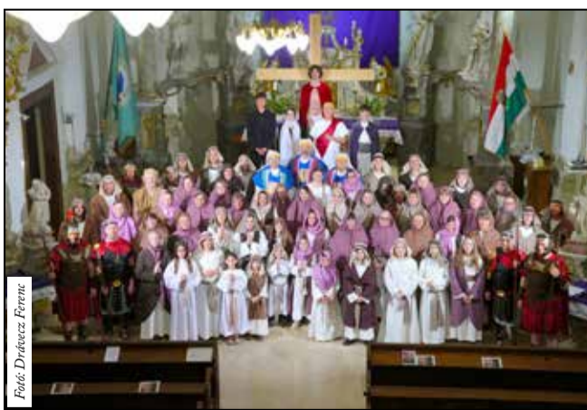
A résztvevők csoportképe

gel küzd. Kapcsolataiban bizonytalan, keresi helyét a világban, és eltávolodott korábbi hitétől is. Egy prédikáció azonban elindít benne egy mélyebb gondolkodást: ki számára Jézus, és mit jelent az ő kereszthalála? Ahogy a fiatalember „belép” a passió történetébe, stációról stációra haladva nemcsak Jézus útját szemléli, hanem saját életére is rávilágít. A történet végére közelebb kerül Krisztushoz – és önmagához is. A darab középpontjában három meghatározó alak áll: Jézus, a Fekete zakós és a Kísértő. Utóbbi egy barátságos fiatalember képében jelenik meg, és folyamatos belső küzdelemre hívja a főhőst. Kettejük „párbeszéde” végigkíséri az esemé-