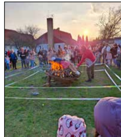
Máglyán égett a kiszébab idén is

A témahét fő attrakciója volt a téltemető népszokás, a kiszébab égetése. A kiszébab égetése nem csupán játék, hanem szimbolikus cselekedet: a szalmabábbal együtt a be-