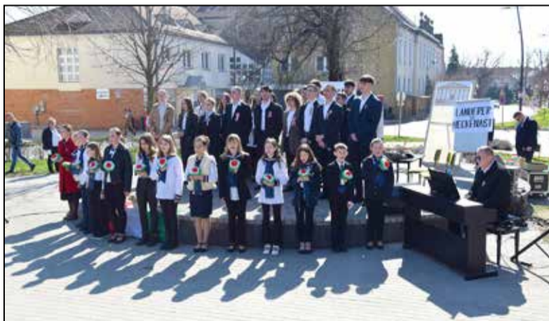
Ünnepi műsor a Túrmezei Rendezvényterén

A beszédet követően a Béri Balogh Ádám Katolikus Gimnázium diákjai adták elő „Március 15. – egy új felfedezés tükrében” című műsor-