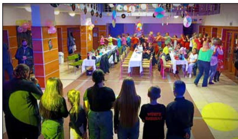
Hajnalgig tartott az idei mulatság