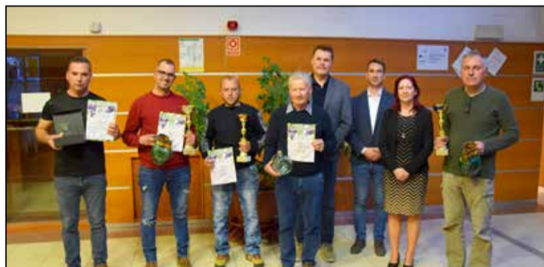
Az idei díjazottak

jó irány, hiszen a tamási termelők újra fontosnak érzik azt, hogy ezen a jeles rendezvényen részt vegyenek, megmérettessék a borukat, ami egyben azt is jelenti, hogy elfogadják a bíráló bizottságnak a szakmai munkáját, döntéseit, amely egy egészséges visszajelzést, kritikát is megfogalmazhat, de ez mindenképpen építő jellegű. – A bizottságok összetétele hasonlóan alakult a tavalyi évhez: fehér, vörös, illetve mivel kevés rozé bor volt, egy vegyes bizottsá-