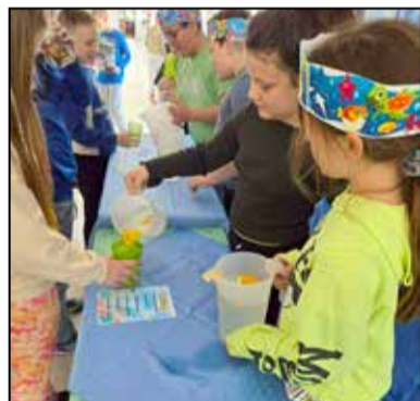
Idén is vidám hangulatban fogyott a víz

A Víz világnapjához kapcsolódóan a Nemzeti Népegészségügyi és Gyógyszerészeti Központ által szervezett HAPPY-hét programban idén már másodszor vesz részt iskolánk. Az egészségfejlesztési program célja, hogy felhívja a figyelmet a vízviselés jelentőségére, a vízfogyasztás népszerűsítésével. A projekthez során kiemelten foglalkozunk a vízzel, a vízvissal. Oktatóvideókat tekintünk meg, vízzel kapcsolatos deko-