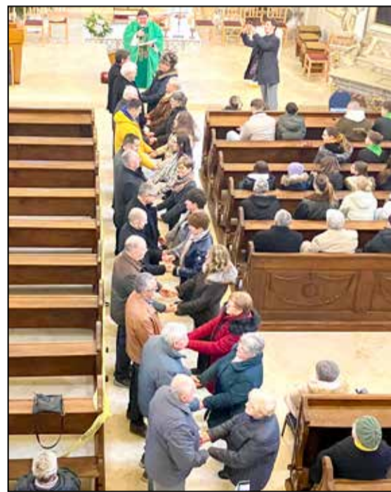
Megáldották a házaspárokat

lóban a szeretetből fakadó, szabad döntés. A hét során a fiatalabb generáció is fontos szerepet kapott. Február 12-én a Tamási Művelődési Központ folyosó galériájában hirdették ki az „Amikor együtt boldogok vagyunk” című rajzpályázat eredményeit. A gyermekek alkotásai őszinte, tiszta szemlélettel mutatták be, mit jelent számukra a szeretet, az összetartozás és a boldog család. A kiállított rajzokból álló ki-