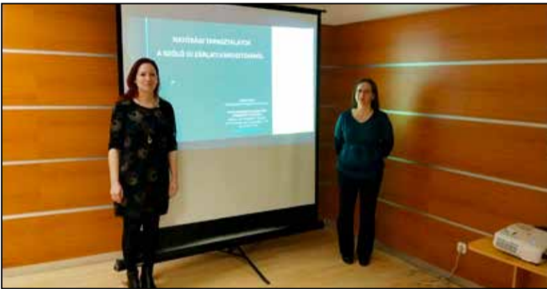
Fontos információk hangzottak el az előadóktól

Az Észak-Tolnai Hegyközség, a Tolna és Fejér Vármegyei Kormányhivatal Agrárügyi Főosztály Növény- és Talajvédelmi osztályának szervezésében szakmai tájékoztató fórum sorozatot indítottak, melynek egyik állomása Tamási volt.