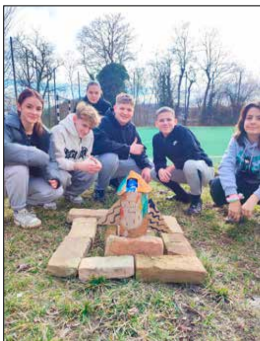
A tamási csapat játék közben

10 óra non-stop nyomozás 7-8. osztályos csapatoknak - Vár a kincsesláda - készen álltok megszerezni? Ezekkel a mottókkal csalogatta a csapatokat idén is a Tolna Vármegyei Szakképzési Centrum és a Tolna Vármegyei SZC Vályi Péter Szakképző Iskola; érkeztek is szép számmal Vásárosdombórról, Kurdról, Tamásiból, Iregszemcséről és Szekszárdról is. A Pályaorientációs Kalandörület egy különleges, 10 órás, valós időben zajló, online nyomozós játék, amelyet kifejezetten a pályaválasztás előtt álló 8. osztályosoknak szerveznek meg. Egy 10 órán keresztül futó, élő online kalandot kell elképzelni, ahol minden csapat egyszerre startol, és logikai, leleményességi és humoros feladatok egyaránt várnak rájuk. Folyamatos kapcsolatban állnak a szervező operátorokkal, és elektronikus úton kapják a küldetéseket, az előrelépést segítő információkat, viszont a saját lakókörnyezetükben, iskolájukban játszanak, ám néha ki kell mozdulniuk a tanteremből vagy a szobából. Minden helyes megfjtés egy lépéssel közelebb viszi a csapatok tagjait a kincsesládához, melyben értékes