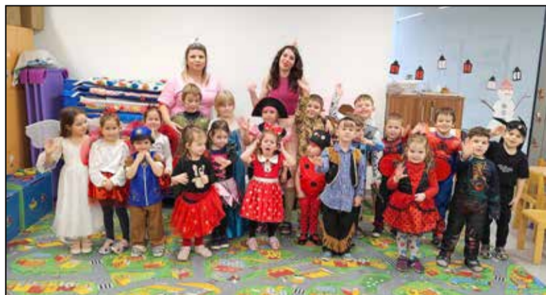
Vidám jelmezekbe bújtak a gyerekek

ző gyermekhangszerek is nagyobb szerephez jutnak, melyekkel nagy előszeretettel kísérik éneküket, vagy éppen csak jólesik egy kis zajt csapni velük. A csoportokból zene-szó hallatszik, mert a gyermekek szívesen gyakorolják a különbö-