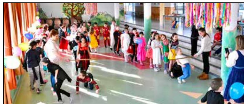
A gyerekek nagyon élvezték a programokat

sekket, mesékkel és dalokkal készült a farsang témájában. A gyerekek lelkesen kapcsolódtak be a közös mondókázásba és éneklésbe is, így a foglalkozás játékos, mégis tartalmas formában bővítette ismereteiket. Délután farsangi sportfoglalkozásra került sor a sportcsarnokban. A program elején a gyerekek közös