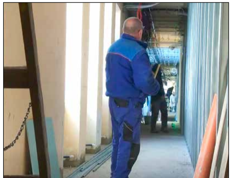
Készül a belső felújítás

Az ütemtervnek megfelelően haladnak az Aranyerdő Óvoda és Bölcsőde felújítási, átalakítási munkálatai. Várhatóan a tavasz közepére elkészül a beruházás, és visszaköltözhetnek az ovisok a jelenlegi, ideiglenes helyszínről.