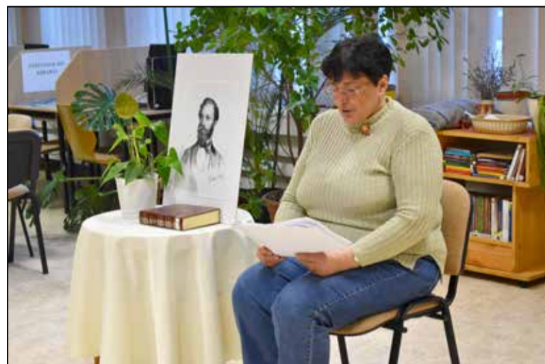
Jókai Mór műveiből olvastak fel

A kiállítás március 7-ig volt megtekinthető, ez idő alatt hatszáznál is többen keresték fel a könyvtárat, hogy megcsodálják a bájos mackókat. Az óvodás és iskolás csoportokat interaktív foglalkozásokkal várták, természetesen macis mesékkel, mondókákkal, medvevadászattal,