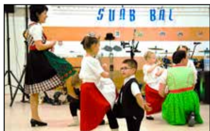
Vidám műsorral készültek a fellépők