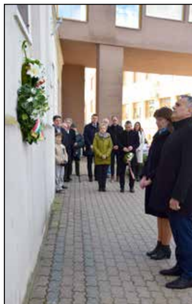
Főhajítás az áldozatok emléke előtt

A polgármester beszédében felidézte a korabeli tamási eseményeket, a vörös, majd a fehér terror helyi áldozataira emlékezve. Felhívta a figyelmet: a mi felelősségünk, hogy megőrizzük a normalitást, megőrizzük a békét és ha bármilyen, idegen eszméket próbálnak ránk erőltetni - nyugatról, vagy keletről -, legyen elég erőnk, hitünk, bátorságunk, hogy ezeknek ellenálljunk, megvédjük szabadságunkat, függetlenségünket. Lebegjen szemünk előtt a recski haláltáborot megjárt költőnk, Faludy György intelme: „Aki nem emlékszik a múltra, az arra ítélte, hogy újra átélje azt.” - zárta beszédét. A megemlékezésen közreműködött