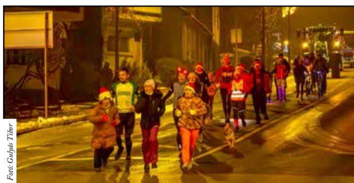
A Szabadság utcát is érintette a futás

A hideg idő nem tartotta vissza a kikapcsolódni, szórakozni vágyókat, és számos tárgyi adomány is összegyűlt. Aki üres kézzel érkezett, a rendezvény ideje alatt nyitva tartó Coop ABC-ből is vásá-