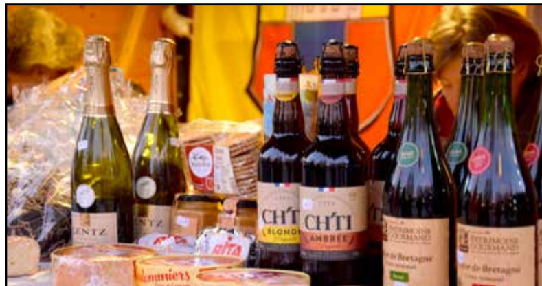
Német és francia termékekkel készültek a vendégek

November végén egy tamási küldöttség utazott Franciaországba, december elején pedig Németországba, melyek viszonzásaként érkezett hozzánk Stollberg és Montigny küldöttsége december 15-17. között. A delegációkat a testvérvárosok polgármesterei vezették. A szervezett kiránduláson megcsodálhatták a téli Balatont, az adventi vásáron pedig ők is saját termékekkel készültek. Nagy sikerrel, hiszen a francia sajtoknak, boroknak, pezsgőknek csak kevesen tudtak ellenállni az adventi rendezvényen. A német forralt bor is szépen fogyott, ami azért is fontos, mert az ebből keletkezett bevétel Stollberg polgármestere a Tamási Aranyerdő