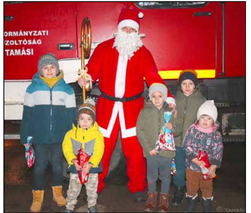
Tűzoltó Mikulás és a gyerekek

A Tamási Önkormányzati Tűzoltók piros szánja ismerős már a Mikulás számára, hiszen nem első alkalommal ült fel rá. 2023-ban sem hagyta cserben a rá váró kicsiket, ismét ellátogatott a gyerekekhez.