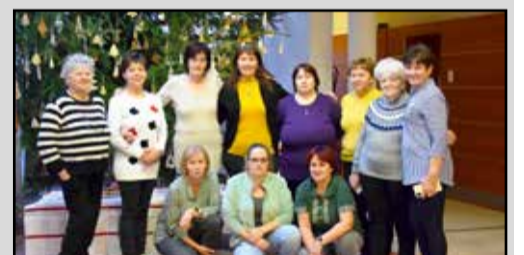
Az alkotók csoportképe

Több mint tíz éve tevékenykedik Tamásiban egy alkotócsoport, akiknek köszönhetően az adventi időszakban mézeskalács illatba burkolózik a művelődési központ előtere.