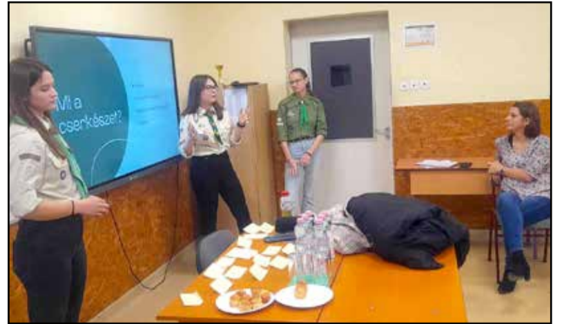
A cserkészettel is megismerkedhettek a diákok

A kisebbeket elvisszük látogatóba különböző cégekhez, intézményekhez, hogy ott helyben kaphassanak ízelítőt az ott folyó munkából. Érthető módon a világjárvány óta a legtöbb cég ódzkodik attól, hogy 25-30 gyereket egyszerre fogadjon, de a legtöbbször megpróbálják ezt megoldani. A nagyobbak az iskolában maradnak, nekik előadásokat és bemutatókat tartanak a legváltozatosabb szakmák autentikus képviselői. Így járt nálunk óvodapedagógus, közgaz-