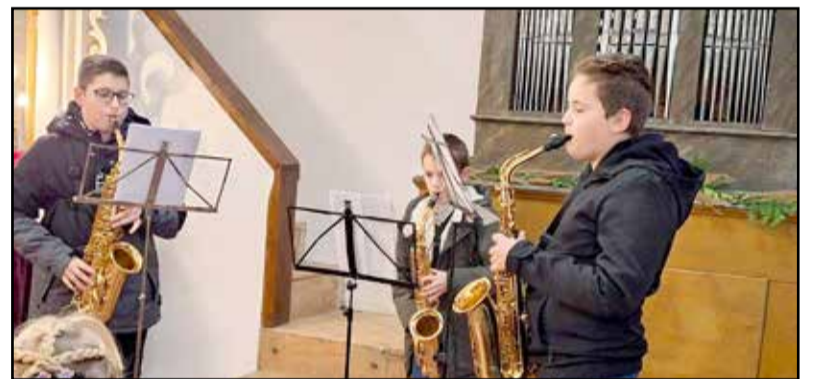
A szaxofon trió öt műsorszámmal készült