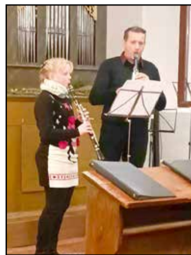
A klarinét duó tagjai