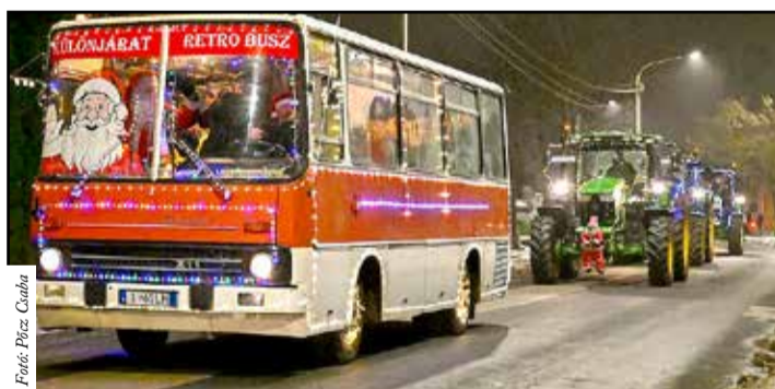
Feldíszített busz és traktorok szeltek az utcákat

rolhatott felajánlást, illetve a forró italokért befolyt becsületkasszás pénzadománnyal is az említett szervezeteket lehetett támogatni, melyet a szervezők egyenlő arányban osztottak el közöttük. A résztvevőket és az adományozókat idén is egyedi készítésű érmelemmel, meleg teával, forralt borral, forró kakaóval, szaloncukorral, zenével, ünnepi műsorral és jó hangulattal várták a szervezők. Az esemény sikerességének köszönhetően már most biztossá vált, hogy a rendezvényt jövőre is megtartják, a szervezők ígérik, hogy a rászorulókat és a ku-