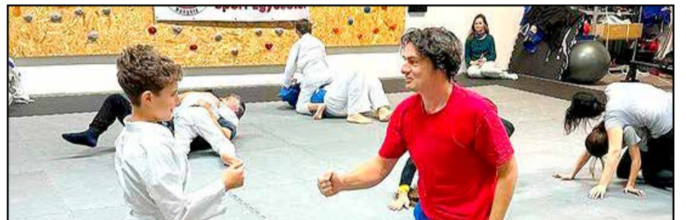
Népszerű volt az apa-gyermek közös sportolás

Az egyesület szakmai programját a Nemzeti Együttműködési Alap és a Bethlen Gábor Alapkezelő Zrt. támogatásával valósítja meg.