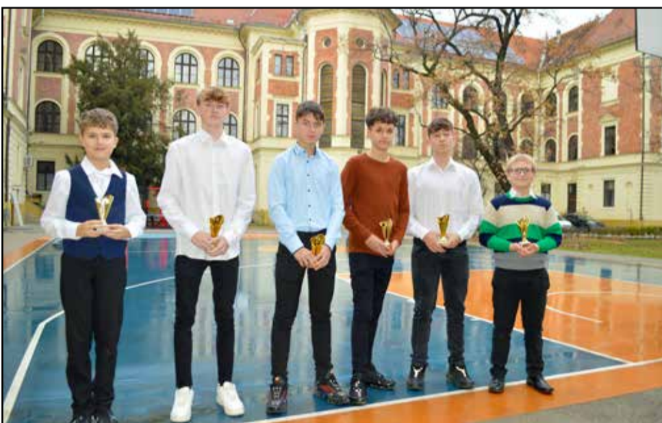
Kerékpársportban kaptak elismerést