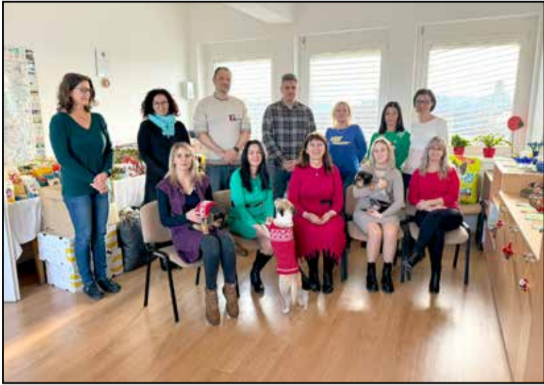
Két szervezetnek gyűjtöttek idén is

A Tolna Megyei Kormányhivatal Tamási Járási Hivatalának munkatársai 2023-ban is gyűjtöttek adományokat, melyekkel sokak ünnepét tették szebbé.