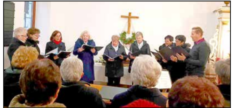
Karácsonyi dalokat énekelt a kórus