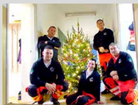
Tamásiba is megérkezett a fa az ünnepek előtt

„Erdészeti, meg amolyan agrárminiszteri nyelven szeretnénk kifejezni az ország köszönetét a mentők egész éves munkájáért” – fogalmazott a miniszter a bejegyzéshez csatolt videóban. A mozgóképes