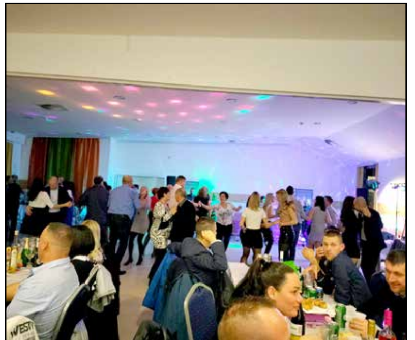
Remek hangulatban telt a bál

A zenekar sem volt újdonság, a StarVoice Bandben idén sem csalódhattunk, fergeteges hangulatot varázsoltak egészen hajnalig. A tombolasorsolás sem maradhatott el, hasonlóan a jótékonyági vásárunkhoz, a bálunkhoz is rekord mennyiségű vállalkozás és magán-személy ajánlott fel tombolatárgyat, ezzel emelve az este fényét. Idén kis újdonsággal készültünk, a MosolyMédia profi fotósai fényképeket készítettek a bálozókról, akik a lencse elé merészkedtek. Közel 120-an ültünk az asztaloknál és táncoltunk a táncteremen, miután az előkészített welcome drinkekkel koccintottunk. A befolyt összegből idén is az intézmény programjait támogatjuk, mivel közeledik a KISZE nap, utána pedig júniusban újra élménydús gyereknapot szervezünk az ovis és bölcsis lurkóknak. Az idei nevelési évben még szervezünk egy már megszokott programot, ami a „Futás az oviért és bölcsiért” nevet viseli, amikor is előre kijelölt kis utunkon gyalogszerrrel, kismotorral, biciklivel, ba-