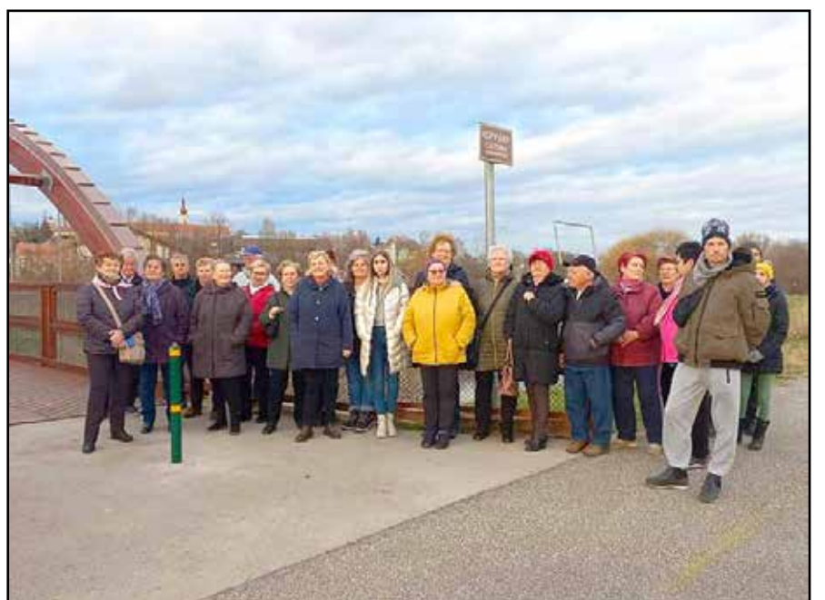
A közös séta alkalmával csoportkép is készült

A tavalyi nagyarányú magyar részvételnek köszönhetően, idén a Liga is bekerült az eseményben anyagi támogatásra is méltónak talált 9 nemzeti betegszervezet közé. Bár számos sétát és felvonulást szerveztek már a daganatos betegségekkel kapcsolatosan, e kezdeményezés formája és a története is egyedül. A projekt egyetlen személyi ötletével kezdődött, aki a rákkal küzdő barátnőjét szerette volna támogatni a sétával. Mára e személyes kezdeményezés világszintű eseménnyé nőtte ki magát, tavaly több mint 650-en gyalogoltak 46 településen, világszerte 3300-nál többen regisztráltak 5 kontinens 30 országának 240 városában. Az esemény különlegessége, hogy nem egyetlen helyszínre és időpontban várják a résztvevőket. Az esemény egy 24 órás világséta, több száz város résztvevőivel. Minden város kap egy előre kijelölt egyórányi időintervallumot sétálni, a világot minden táján egyformán, és