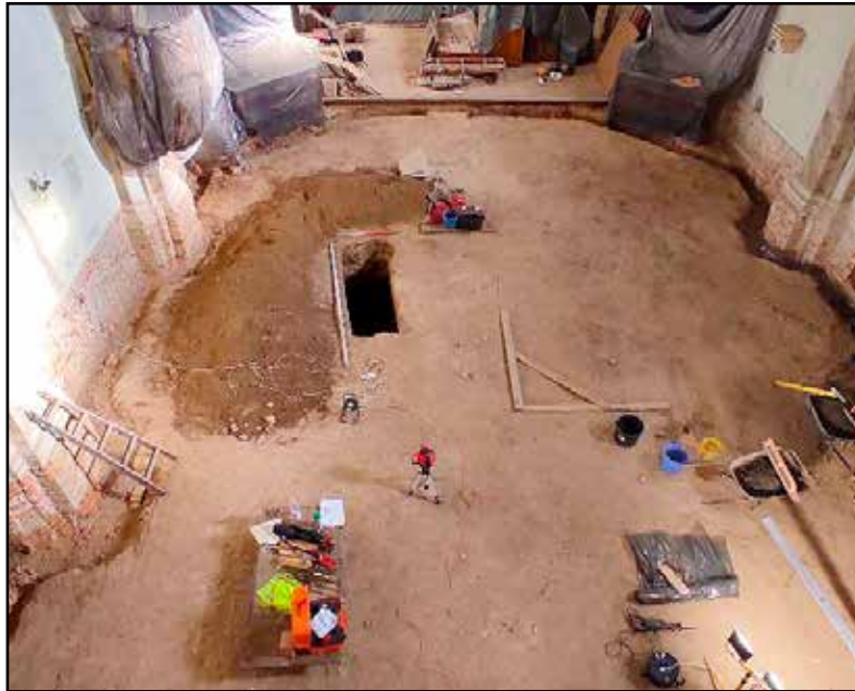
A sírgödör elhelyezkedése a templombelsőben

A temetkezés feltárásának kezdetén kiderült, hogy a sír már valamikor régebben megsüllyedt, mert négy, habarcsba rakott padlótégla-