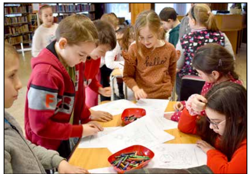
A gyerekek élvezettel színezték ki Kippkopp figuráját