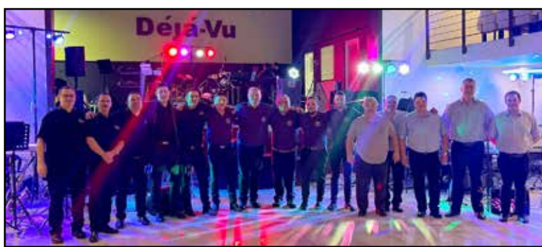
A három fellépő zenekar tagjai

Mindhárom zenekar kétszer másfél órát játszott, szünet csupán addig volt, amíg a következő zenekar elfoglalta a helyét. A bált a Sprint