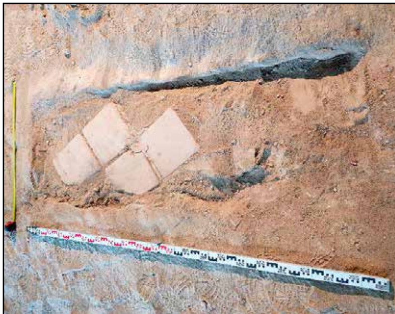
A megsüllyedt sírra a 19. századi elején lerakott padlótégla

val egyenlítették ki a gödör felső részének megrokkadását. A téglák alatti habarcsból 1812-es krajcár került elő, tehát az 1725-ben ásott sír már egy évszázaddal később látványosan megsüllyedhetett. A sírgödör egyik sarkán félkör alakú, valószínűleg tudatosan kialakított kiugrást találtunk, ami lejjebb egy kis padkába ment át: talán a sírásók készítettek lépcső gyanánt. (Itt érdemes megemlíteni, hogy a sír falának kemény földjében jól kivehetőek voltak a 18. századi szerszámok lenyomatai is.)