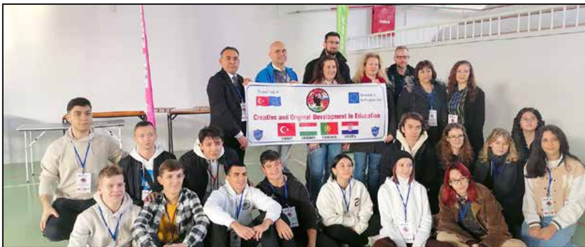
Tartalmas napokat töltöttek a diákok Törökországban

Törökország ázsiai részére érkezünk, ahol a török kollégák és a gyerekeket fogadó családok az első perctől kezdve megnyugtató kedvességgel fogadtak bennünket. Ez különösen jól esett azok után, hogy Budapestről megérkezve az isztambuli repülőtéren lekértük a csatlakozást – nem segített a zokniban futás sem a dolgon, így csak egy későbbi időpontban értünk célba.