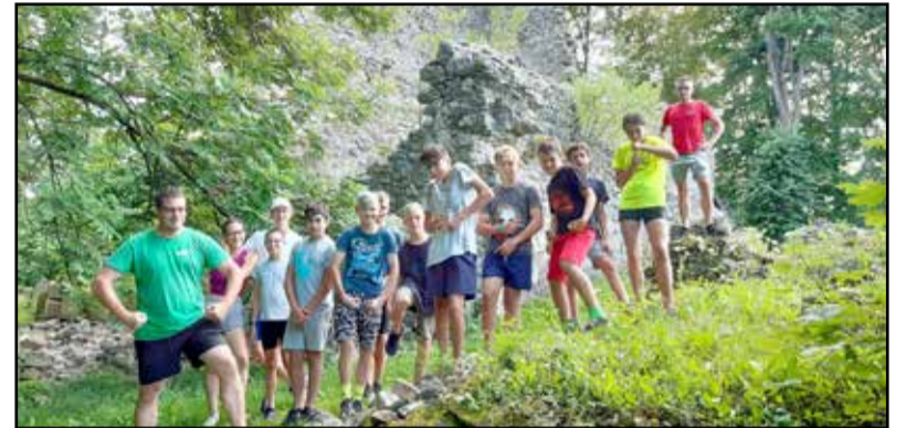
Bringások a Bükkben

Az időjárás és az útvonal egyaránt pazar volt. Igaz, 2 éve végigtekertük már ezt a környéket, de most is tudott újat mutatni. Az időjárásnak köszönhetően megcsodálhattuk a bükki füvesember gyógynövénykertjét, feljutottunk a Bükk-fenn-