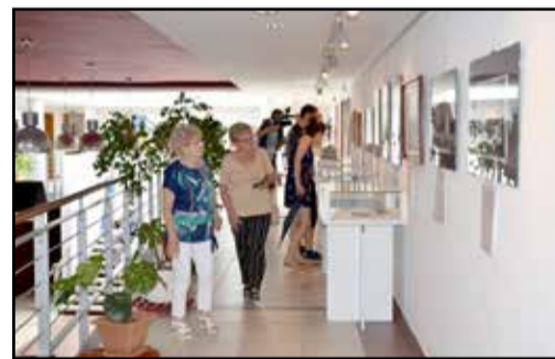
A kiállítás augusztus végéig tekinthető meg