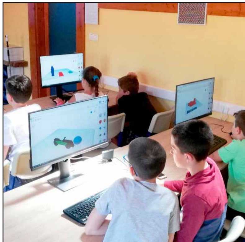
Sok területen kipróbálhatták tudásukat

hangsúlyozta, a megújult laborral egy elképesztően jó lehetőség került az intézményhez, melyet min-