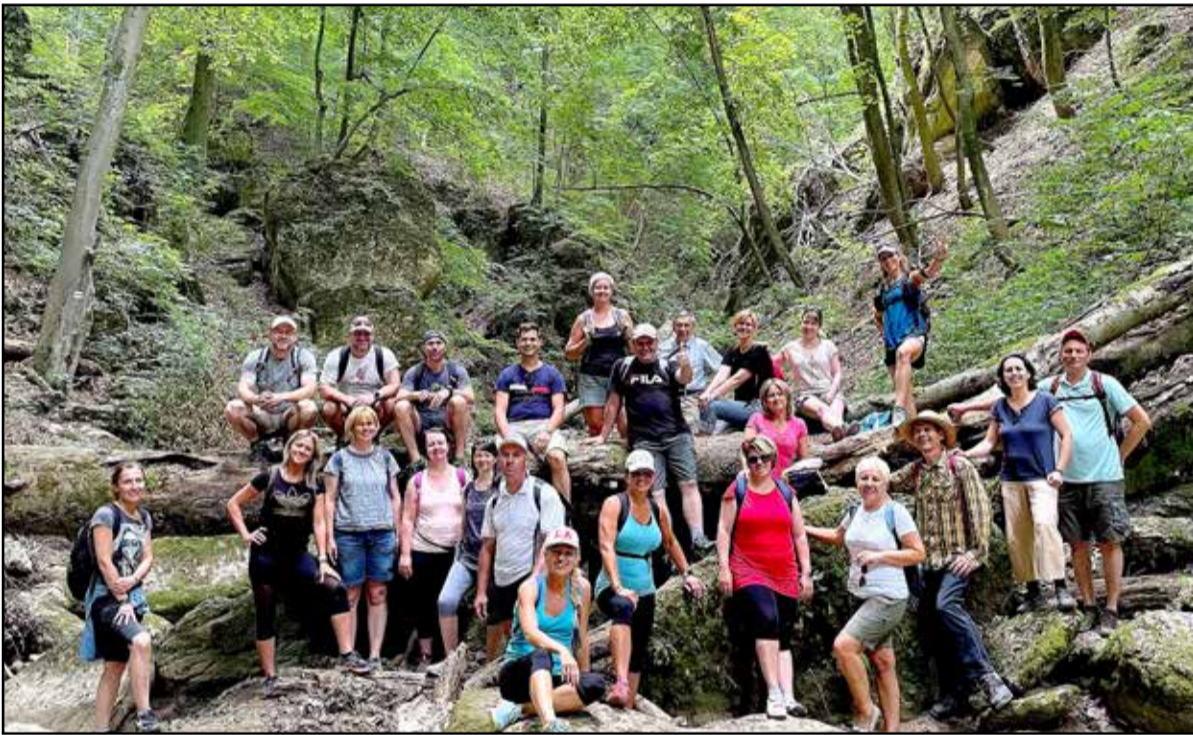
Gyönyörű környezetben a vályisok

vizgázott összetartásból is: néhol nevetve, néhol hangosan biztatva segítették át egymást a nehezebb terepeken. A túra végeztével, aki nem purcant ki teljesen, pár perces sétával felmászható a cseszneki vár romos falai közé, ahol hangulatos sétát tettek, és megcsodálták a nem mindennapi kilátást a Ba-