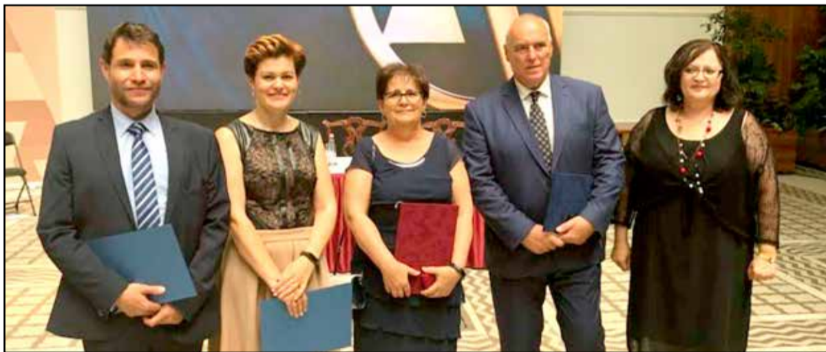
A Szekszárdi Törvényszék kitüntetettjei

szakvizsga letételét követően 2006. augusztus 1-től kapott bírósági titkári kinevezést. 2008. október 1-től a Tamási Járásbíróság polgári ügyszakos bírójává, ahol főként kötelemi, kártérítési, végrehajtási és családjogi perek tárgyal.