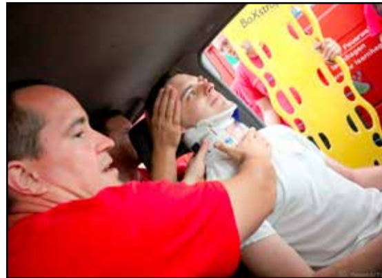
Több eszköz használatával is megismerkedhettek a tűzoltók

A nap során a délelőtti elméleti képzést követően helyismereti foglalkozásra került sor a Hőgyészi Hegyhát Általános Iskolában. Még mielőtt a helyszínre értek volna a tűzoltók, egy balesetnek voltak szemtanúi, ahol azonnal be is avatkoztak. A helyszínen egy személygépjármű, valamint egy busz ütközött össze, és képeztek forgalmi akadályt fél pályán. A helyszínen a kint tartózkodó egységek a forgalmat irányították fél pályán a rendőrség megérkezéséig. Ezt követően megkezdődött a foglalkozás, azonban ez sem tartott sokáig, ugyanis bejelentést kaptak egy önkéntes tűzoltó kollégától, hogy Pári külterületén gabonaföldön, illetve tarló égen, amely erdős rész is veszélyeztetett. Az állomány a helyismereti foglalkozást azonnal felfüggesztette, és mindkét gépjárműfecskenővel megkezdte a vonulást a káresekhez. A Tamási