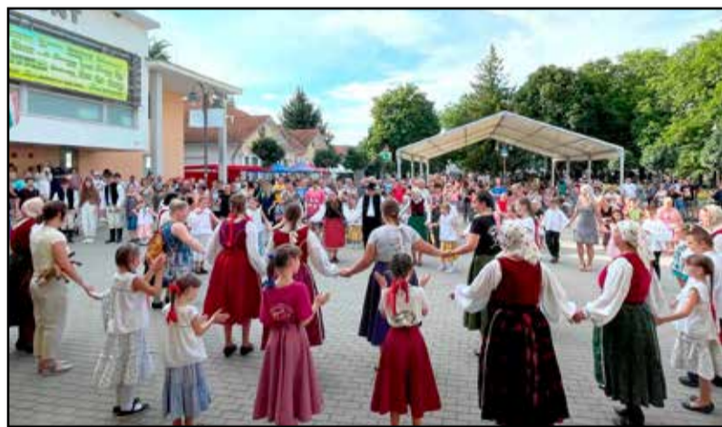
Színvonalas produkcióval készült a Pántlika néptáncgyűtes

kor azt érzi, hogy volt értelme eljönni és segíteni, hiszen sok apró trükk van, amit honnan is tudhatnának azok, akiknek nincs háttér segítségük. Én most az akartam lenni, segíteni, és úgy érzem, ez sikerült is. A lényeg azonban, hogy az emberek szeressenek főzni, enélkül nem megy, a többi pedig csak tapasztalatgyűjtés. Akarjunk finom ételeket készíteni, hiszen ezzel nem csak örömet szerünk az embertársainknak, hanem tápláljuk is őket.