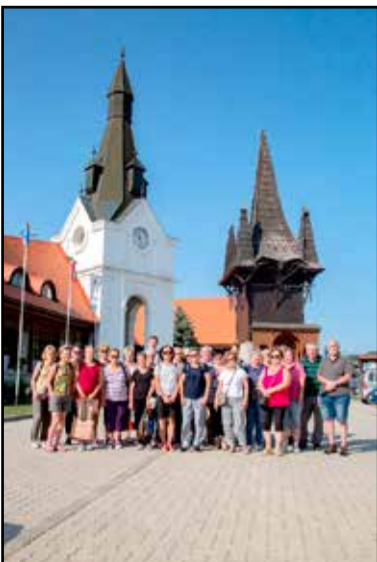
Gyönyörű helyekre látogattak

amit eredeti állapotában újítottak fel, ezzel is betekintést adva abba a kultúrába és életbe, amit sváb őseik hagytak rájuk. A társaság másik része pedig a tájházban nézhette meg az eredeti bútorokkal, háztartási eszközökkel, népviselettel berendezett szobákat. Végig mentünk a konyhától a hálószobákig át egészen a tiszta szobáig, és átélhettük, feleleveníthettük gyerekkorunk egy-egy emlékét. Látogatásunk végén közösen megnézhettük az épp falújítás alatt álló római katolikus templomot is. Ezek a fotók beszéljenek helyettünk, amit kirándulásunk során készített Kai Müller.