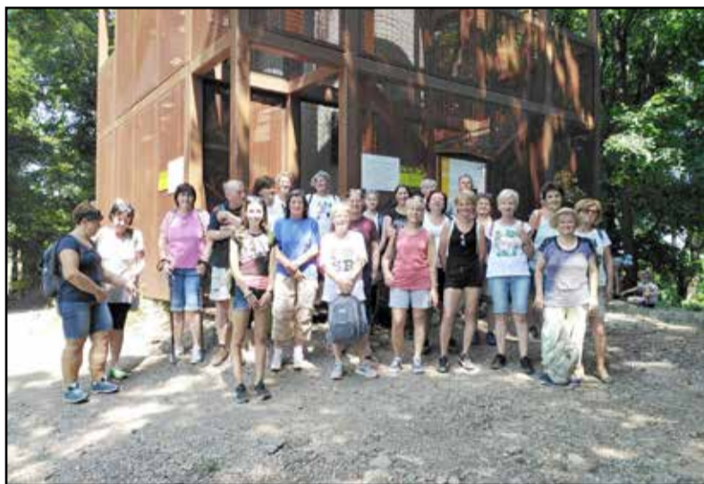
Tartalmas napot tölthettek együtt a résztvevők

A tamási természetjárók július 24-én egy szép napot töltöttek el a Mecsekben túrázva.