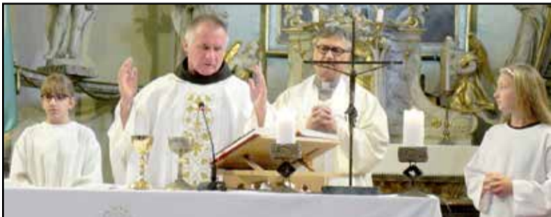
Nagy érdeklődés övezte a misét