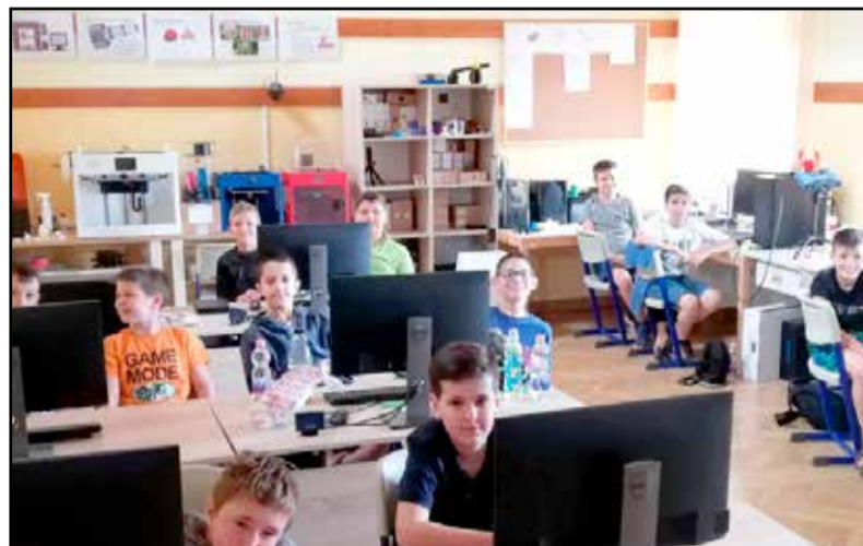
A gyerekek nagyon élvezték a táborban töltött napokat

Első alkalommal szervezett nyári napközitábort a modern technika iránt érdeklődő gyerekek számára a Tolna Megyei SZC Vályi Péter Szakképző Iskola és Kollégium. Az intézmény megújult 3D laborjában minden feltétel adott volt ahhoz, hogy a Vályi Robot-olimpia és 3D nyomtatás tábor során a fiatalok játékos formában tegyenek szert olyan ismeretekre, készségekre, amelyeknek a mai világban nagy hasznát vehetik.