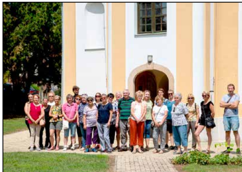
A tamási kirándulók csoportképe