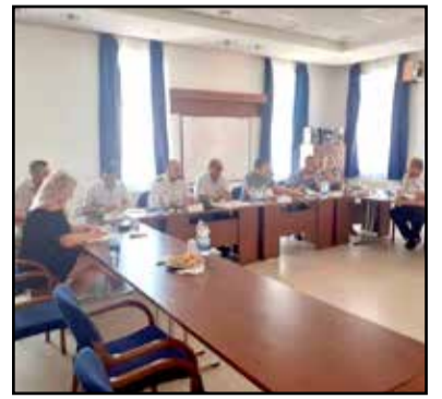
Megvitták a kistérségekben felmerülő problémákat

A Tolna megyei Területi Kisebbségi Kapcsolattartó Munkacsoport és a Tolna Megyei Cigány Nemzetiségi Önkormányzat képviselői találkoztak a megye két városában.