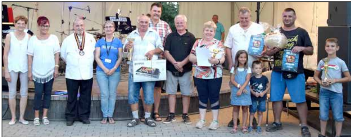
A zsűri tagjai és a helyezettek

főzőversenyeken, hogy elmondhatom ezeket, és most is találkoztam olyan versenyzővel, aki visszamondta, hogy mit hallott tőlem két évvel ezelőtt. Az ember ilyen-