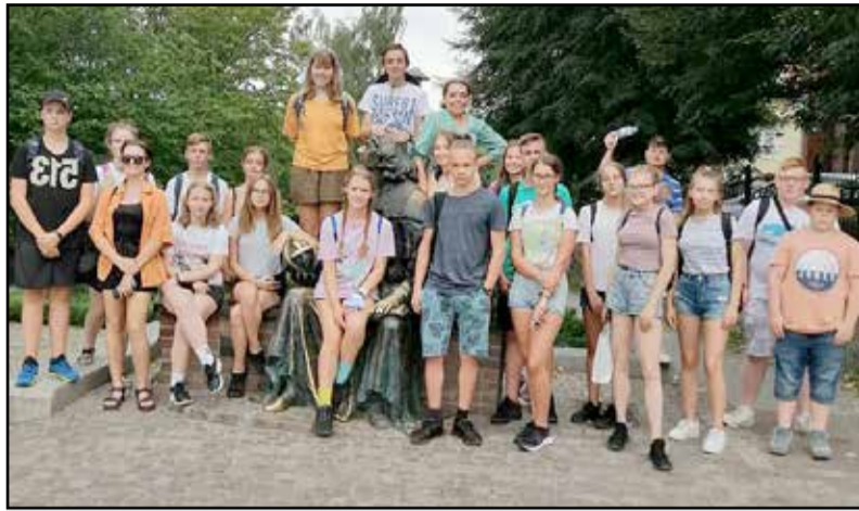
Ismét életre szóló élményeket szereztek a diákok

A lengyel házigazdák kitétek magukért. A program olyan színes és átfogó volt, hogy csak kapkodtuk a fejünket a sok-sok élmény sodrában. A látogatás a lengyel country-fesztiválon önmagában is hatalmas esemény a helyiek és a turisták számára, ám amikor a klasszikus country-számokat lengyelül hallgathattuk, lelkes tánckar produkciójával kiegészülve, kissé szürreálisá vált az egész, ettől lett olyan emlé-