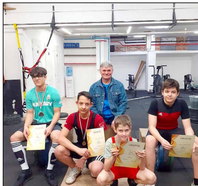
Az idei év első versenye sikereket hozott