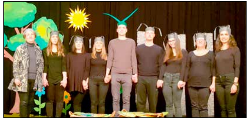
Jelmezbe bújtak a művelődési központ munkatársai