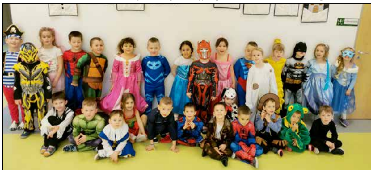
A Katica csoport jelmezei

Sajnos a vírushelyzet miatt minden csoport a saját csoportszobájában volt kénytelen megszervezni az ünnepeket, ám ez nem szegte kedv-