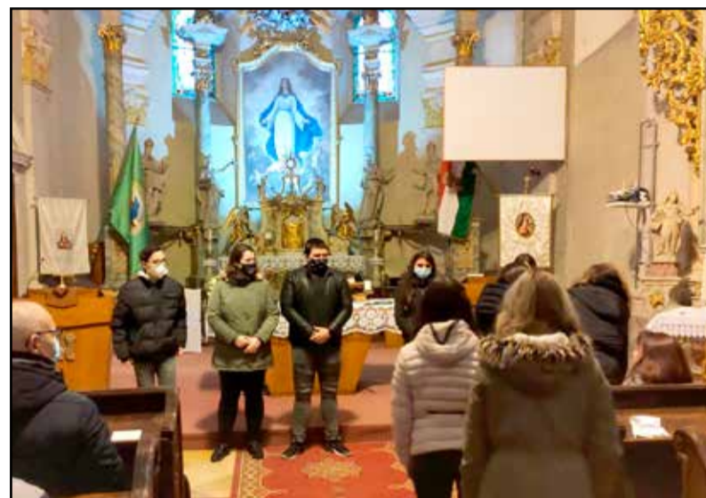
Feltűzték a végzős gimnazistákra a szalagokat

Autóban várakozó szülők, meghatott pedagógusok, kesernyesen mosolygó végzősök – nem a megszokott ünnepi hangulat