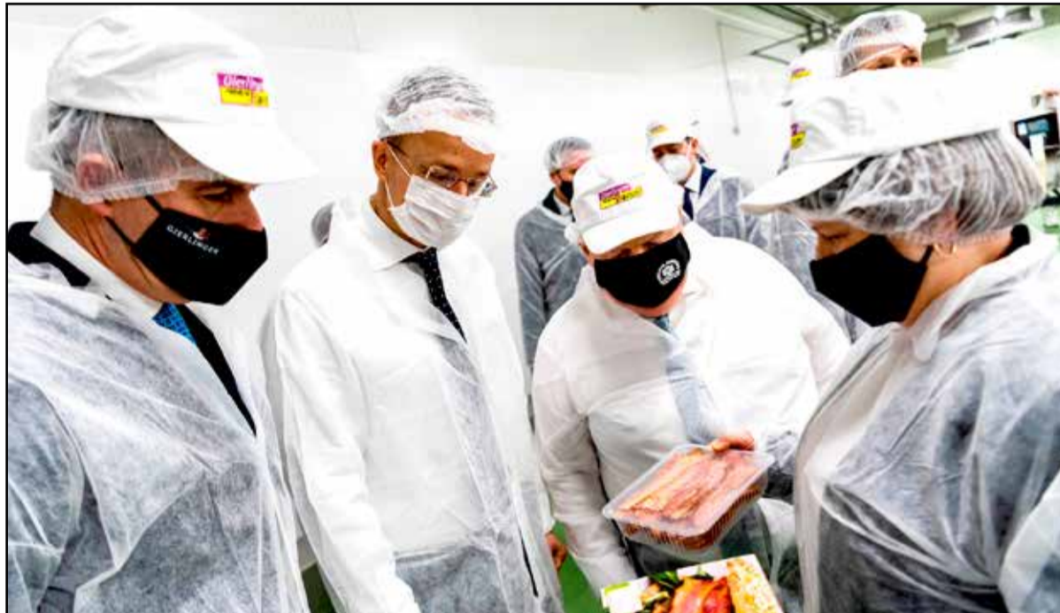
Gyárlátogatás is zajlott a nap során

te meg. Ezt ismerte fel a magyar kormány akkor, amikor úgy döntött, hogy a magyar gazdaságtörténet egyik legjelentősebb beruházásösztönzési programját indítja el, amelynek keretében soha nem látott mennyiségű, 1430 beruházás jött létre vagy kezdődött el Ma-