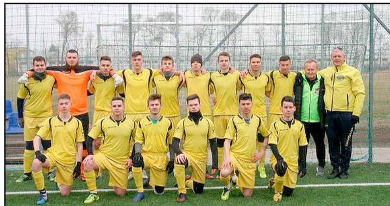
Az U19-es csapat és edzőik

tek - mérkőzésekkel is. Tisztelet parancsolóak azok eredményei: a Magyarkeszi SE (felnőtt) csapatát 13-1-re, a Zomba SE (felnőtt), a Cece PSE (felnőtt) és a Fonyód PSE (felnőtt) csapatait egyaránt