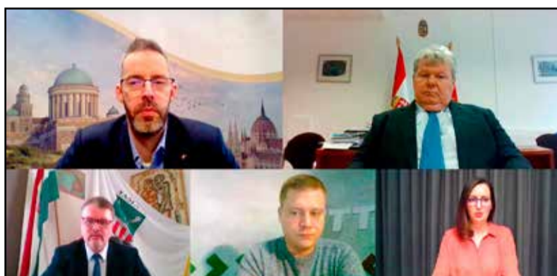
A járványhelyzet miatt online zajlott a konferencia

bízunk, hogy a fejlesztés eredményeként még több vendég érkezik Tamásiba, valóban megvalósul egy olyan négy évszakos kínálatbővítés, amely ahhoz fog hozzájárulni, hogy egész éves szinten legyen turizmus a térségben, természetesen ehhez a későbbiekben kapcsolódhatnak majd egyéb szálláshely fejlesztések és bővítések is.