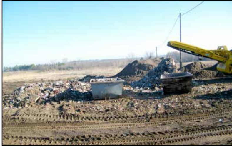
170 m 3 illegális szemetet számolta fel a munkálatok során

Az illegális hulladélerakás az egyik legsúlyosabb környezeti probléma, azon túl, hogy szennyezi a környezetet, közegészségügyi veszélyeket is rejt magában. Súlyos problémát jelent a település területén az utak mellett, az erdőkben, az elhagyott területeken, a magán vagy önkormányzati közterületeken és a külterületi ingatlanokon illegálisan lerakott lakossági kommunális, vagy építési hulladék.