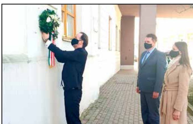
A városvezetők is elhelyezték koszorújukat