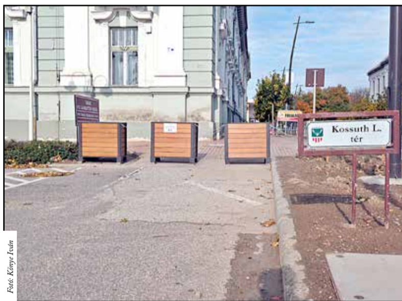
Átalakult a forgalmi rend a Kossuth téren

nálban van. Sokan látogatnak ki a fenyvesbe, amely újra népszerű kirándulóhely lett. A harmadik elem a Dám Pont Látogatóközpont. Az itt található kiállítótér bemutatja a város és a térség természeti és kulturális értékeit, építészeti örökségét, hagyományait. A kiállítóteret nem