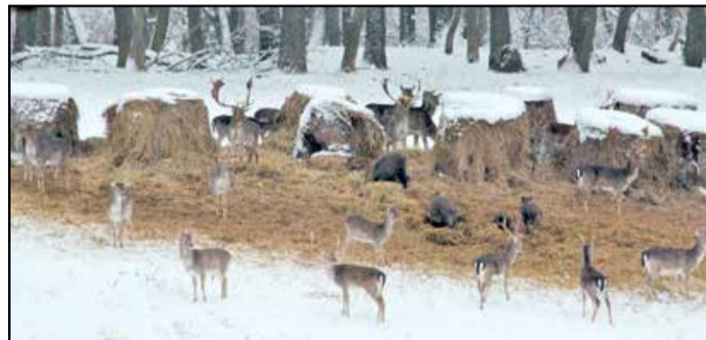
Téli etetés az erdőben

ról a Gyulaj Zrt. által kiadott és kontrollált gyűjtési engedélyekkel - végig járják a vadrejtő sűrűket, a nappalozó beálló helyeket. Az erdőgazdaság a saját mezőgazdasági tevékenysége során megtermelt takarmányfélét használja fel a vadetetésnél, melyek elsősorban szemes kukorica, lucernaszéna, illetve szenázként kerül a területre.