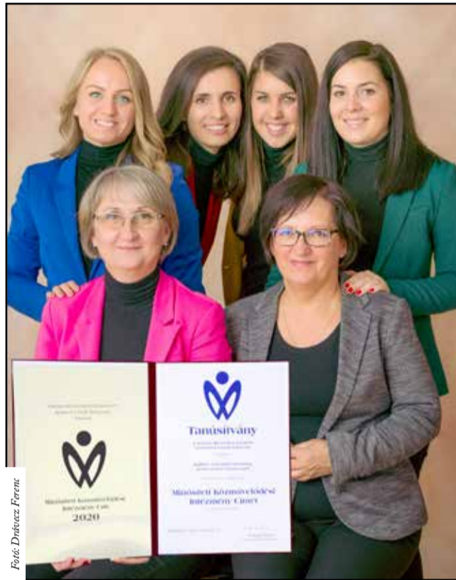
A Tamási Művelődési Központ kollektívája az elismeréssel

Az elnyert minősítés üzenet a szakmának, a fenntartónak és a települési közösségnek is. Szakmai szempontból kiemelkedő, mert a művelődési központ egészének működését vizsgálta, beleértve a szervezetséget, a tevékenységek mennyiségét és minőségét, a munkavégzés hatékonyságát, a jó gyakorlatokat, a minőségbiztosítási rendszer egészét, a teljes intézményi dokumentáció szabályszerűségét. A fenntartó számára fontos visszajelzés, hogy intézményében olyan munka folyik, mely érdemes a támogatásra és számára is komoly büszkeségre ad okot. Szól a nagyközönségnek is, hiszen a látogatók számára egy fontos jelzés, hogy egy komoly – alapjaiban Európai Unió modellre építő – minősítésnek meg tudott megfelelni az az intézmény, melynek