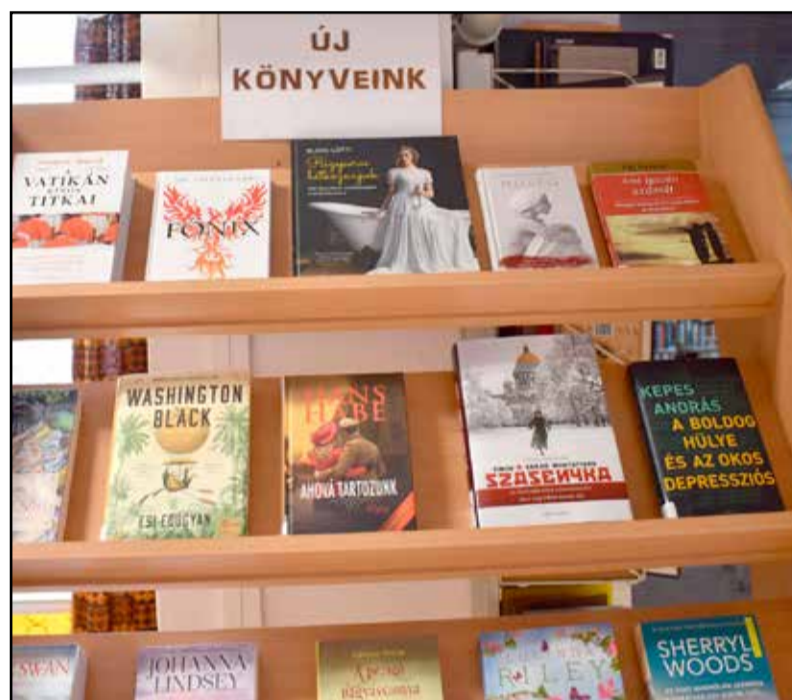
Mindig készülnek új könyvekkel az olvasóknak

ló címkét, ami nagyban megkönnyíti a polcokon levő válogatást, keresgélést. Könyvtárunk „zöldítése” felé haladva szakkönyveink minden tudományterületéről válogattunk a „zöld” témához illő könyveket, többek között a fenntartható fejlődés, a természet-és környezetvédelem, az egészséges életmód, a biogazdálkodás témájában. E kötetek gerincére zöld jelet ragasztottunk, ami szintén segít a téma megismerésében. A zárt ajtó mögött fontos szakmai háttér munkák is zajlanak. Olvasói és kölcsönzési adatbázisaink ellenőrzését el tudtuk végezni. Fel-szólításokkal próbáljuk kint levő és