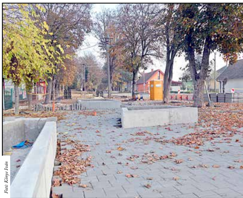
Munkálatok a Zrínyi utcai üzletsor előtt

retnek megszólítani. Az épületben van egy ököbüfé és egy vizesblokk, amelyek a parkerdőbe látogatók kényelmét is szolgálják. A látogatóközpont és az előtte lévő terület alkalmas arra, hogy a város egyik legnagyobb rendezvényét, a Trófea Vadgasztronómiai Fesztivált a jövő-